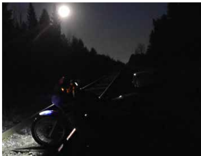
Pimeys, kylmyys ja kuu seurana, kun pyörä päätti olla itsepäinen ja jämähti kiskojen väliin.