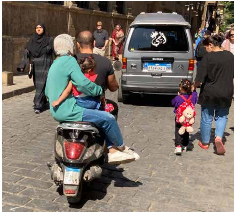
Egyptin moottoripyöräilykulttuuri on suomalaiselle outoa. Pyöriä on paljon, kypäriä vähän.