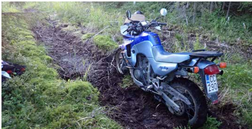
Työnnä vain, kyllä se siitä! Tai sitten ei.

Pyysin apua Taivaan Isältä, joka lempeästi kehotti ottamaan yhteyttä maalliseen isään. Niinpä niin, kukapa isä ei riemulla rientäisi saunailan päätteeksi puolen tunnin metsälenkille Närpiön hakkuuaukealle, kun tytär näitisti pyytää? Pääsin pinteestä