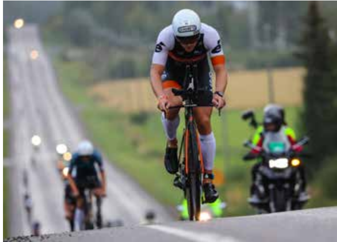
IRONMAN Finland Facebook-sivusto

Yhteenkuuluvuus ja yhdessä vapaaehtoisesti työntekeminen oli teema, joka sai amerikkalaisen organisaation antamaan maininnan: Parhaiten järjestetyt Ironman-kilpailut koskaan. 6400 urheili-