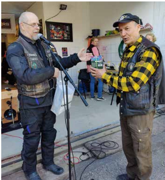
Vespa ja PeeTee. Onnittelut Lahden alueelta muistojen kera Tampereen tallille ja GR Tampereen motoristeille toivotuksena armon vuosia vuosikymmeniksi eteenpäin.