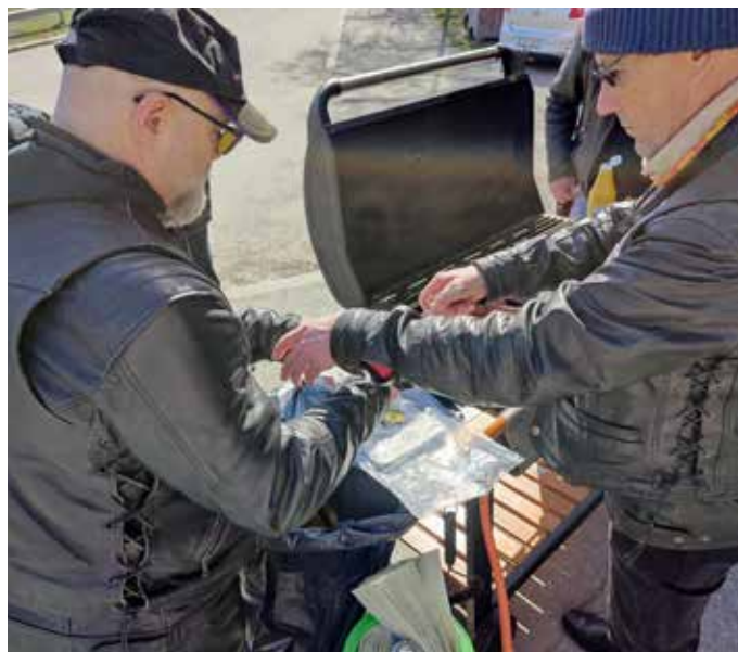
Makkara maistuu aina