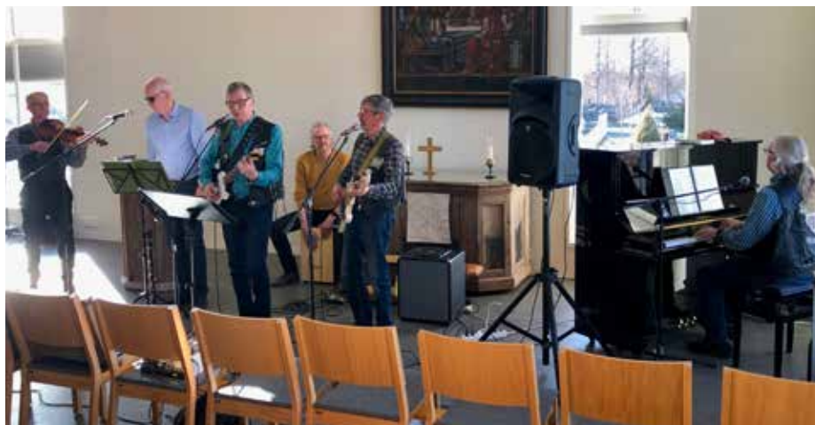
Botnia-band pisti parastaan Alavetelissä