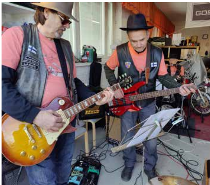
Manse gospel band