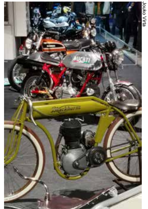
Messuilla oli näytillä myös vähän vanhempaa kalustoa.