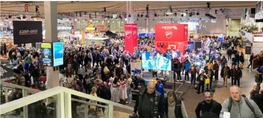
Pee Tee Juntunmaa

Lauantaina messuilla oli ruuhkaisinta yli 31 000 kävijän toimesta. Perjantaina kävijöitä oli n. 15 000 ja sunnuntaina n. 10 000 kävijää.