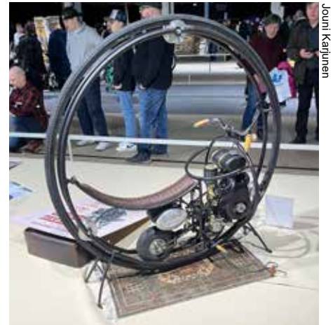
Aika mielenkiintoinen moottoripyörä.