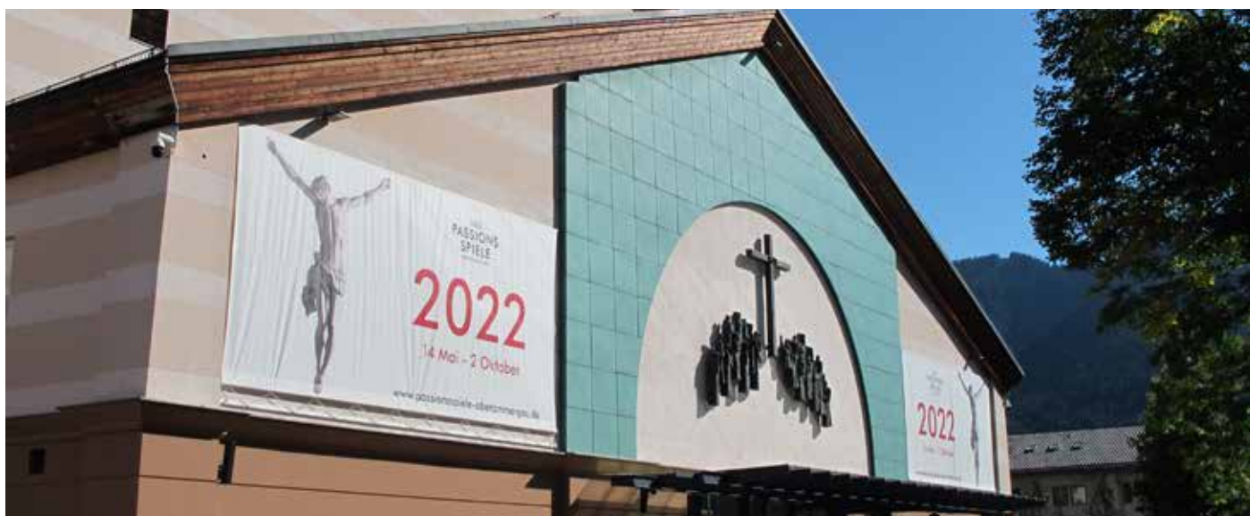
Teatteritalon julkisivulle oli laitettu näytelmän isot mainoslakanat. Valtavan talon pääovesta pääsi vain näytelmä-museoon, katso-motiloihin oli yhteensä kymmenen ovea sivustoilla.