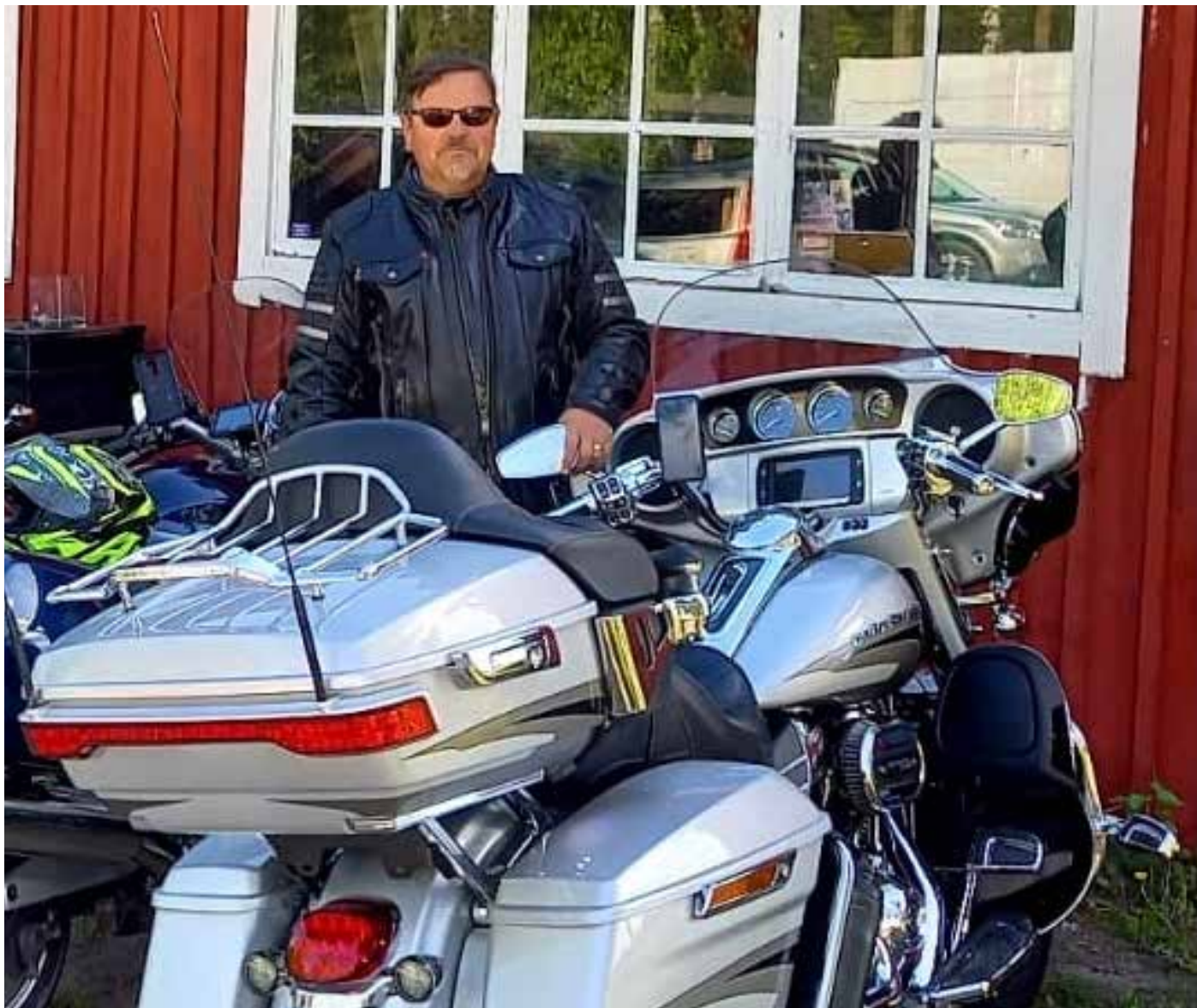
Gospel Riders -kerhon uusi puheenjohtaja on kokenut harikkamies