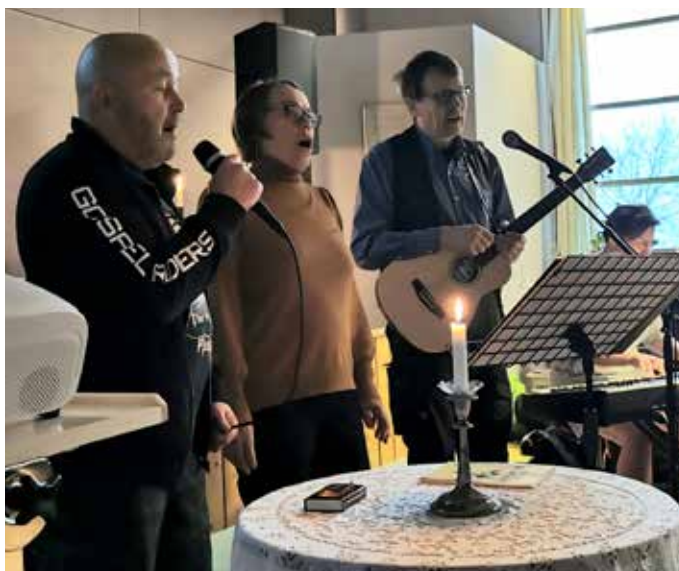
Musiikki on tärkeässä osassa Gospel Riders toiminnassa.