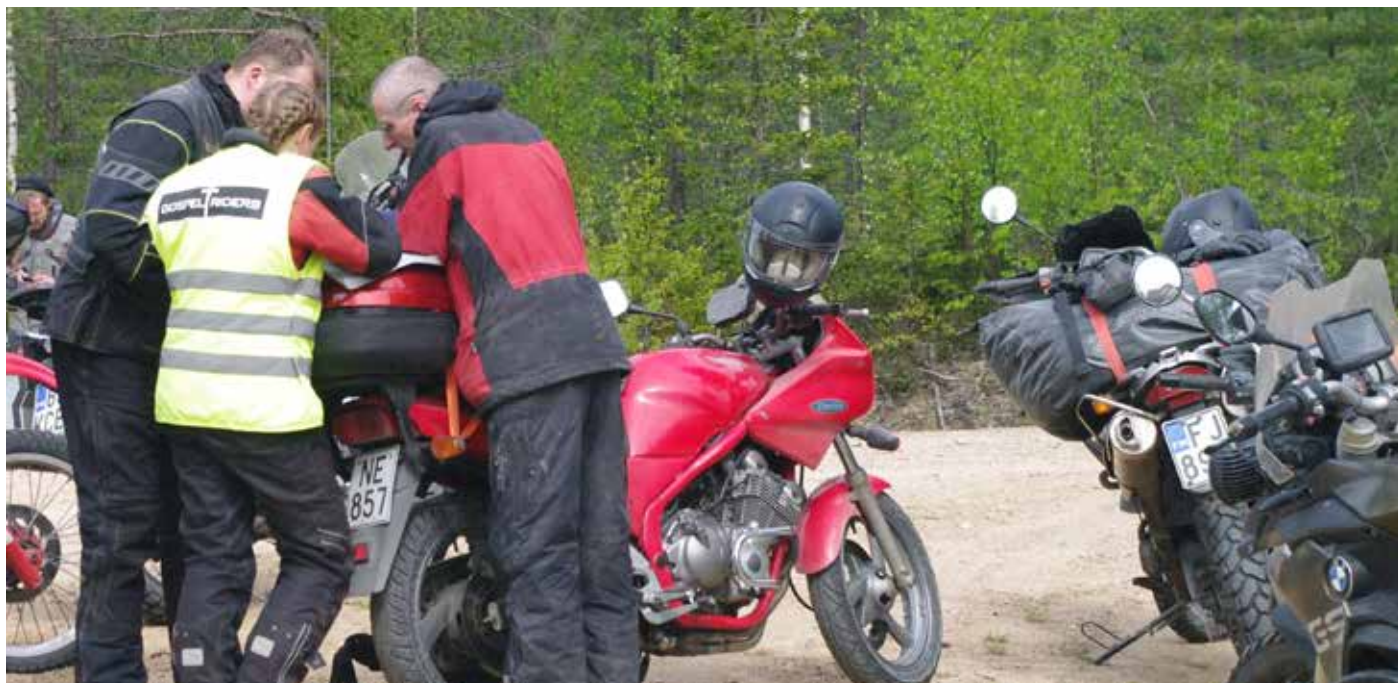
Karttaa piti tutkia tarkkaan varsinkin syrjäisemmillä etapeilla