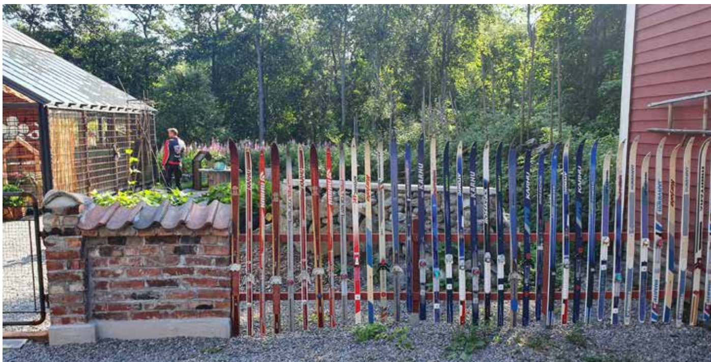
Suksien uusi elämä Strömsössä.