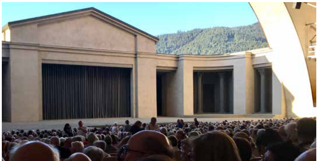
Teatteritalo oli näyttämön kohdalta avoin. Näytelmä tapahtui siis avotaivaan alla, verhon takana oli lähinnä vain kulissirakenteita. Näytelmän ensimmäisen näytöksen jälkeen oli kolmituntinen ruokailutauko, toinen näytös päättyi vähän ennen kello 23:a.