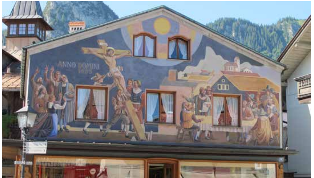
Oberammergaun keskustan taloissa on paljon seinämaalauksia, joiden aiheet liittyvät historiaan ja kärsimysnäytelmään. Huomaa teksti "Anno Domini 1633".