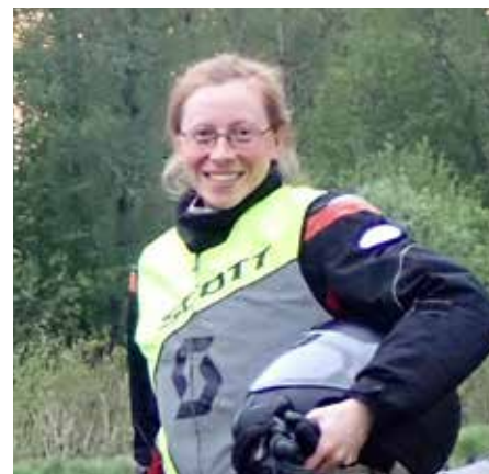
Itärajan rukousajo oli suuri ilo ja elämys.

Tämän lyhyen ja ytimekkään keskustelun jälkeen katkera vaikerrus vaimeni, ja kykenin hyväksymään velvollisuuteni. Vaikka olin surullinen joutuessani jättämään joukon, tuntui, että olin saanut sanan Herralta lähimmäiseni kautta, eikä enää kannattanut kapinoida Jumalan tahtoa vastaan. Onneksi meidän Herramme kestää lastensa ymmärtämättömät kiukuttelut.