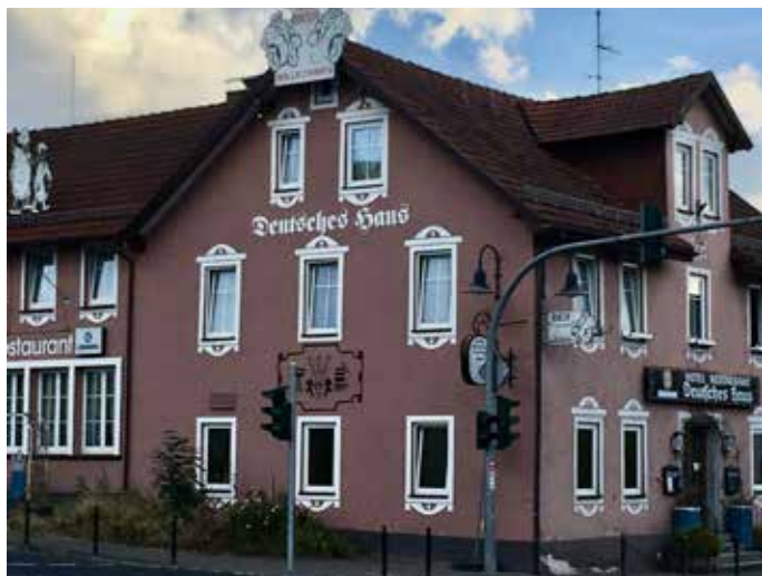
Yövyimme puolessa välissä Saksaa Bad Brückenaussa mo-toristihotelli Deutsches Hausissa 7-tien varrella vähän Fuldan alapuolella.

Valmistautuminen alkaa jo edellisen vuoden alussa, jolloin rooleihin valitut mies-