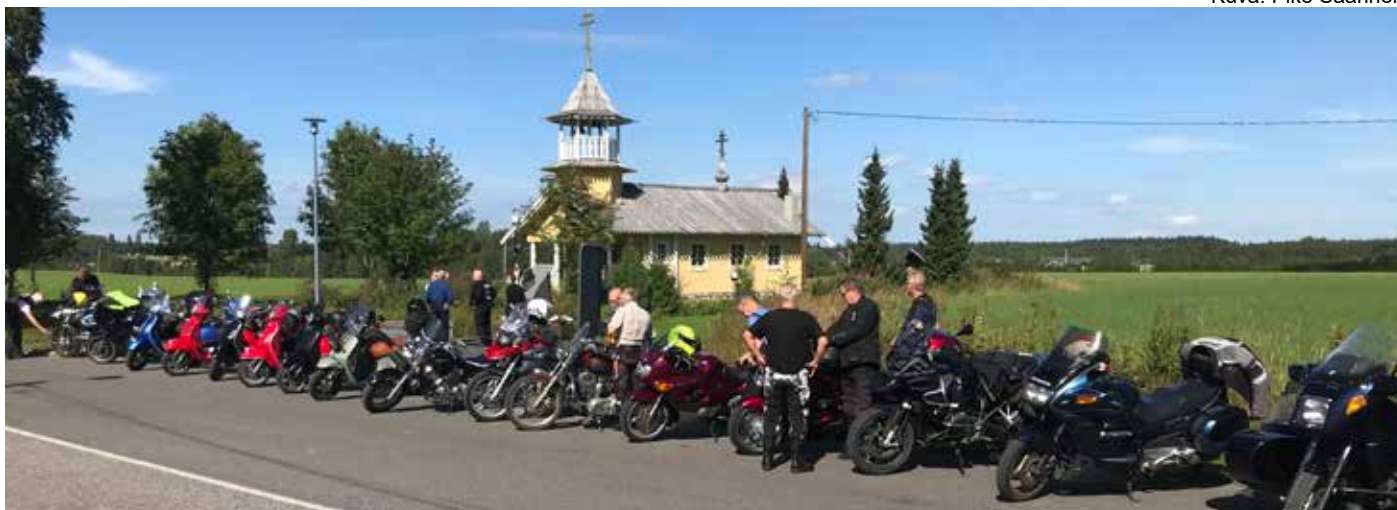
Motoristit menossa Alapitkän tsasunaan