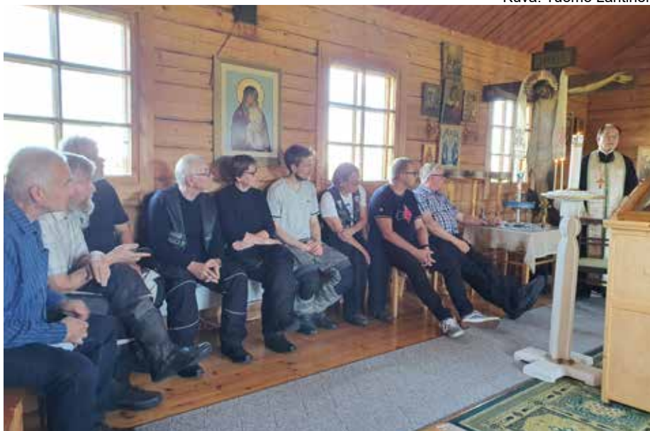
Gospelriderit kyselevät Isä Martilta tsasounan historiasta.