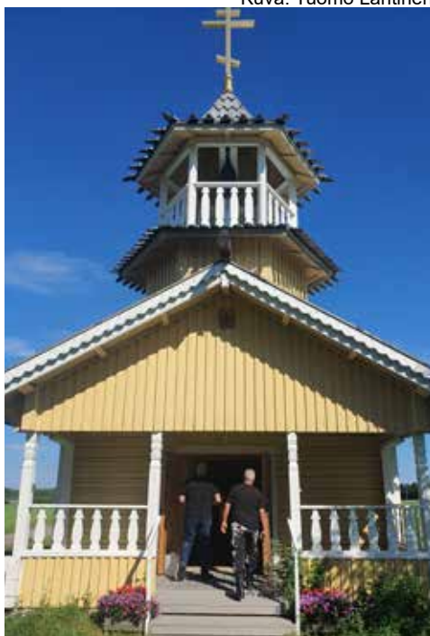
Kirkkokierroksen viimeinen tilaisuus alkaa!