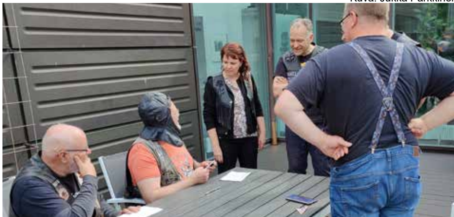
Visaisia kysymyksiä ja tehtäviä.