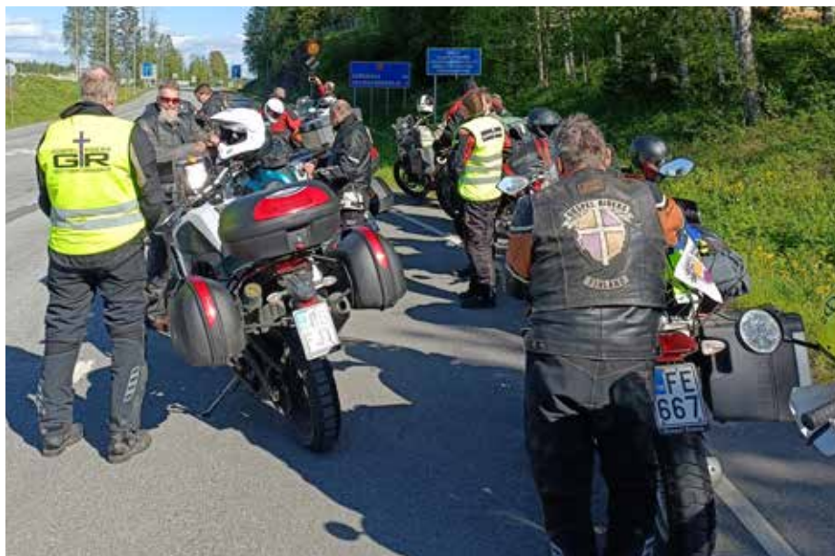
Edessä Niiralalan raja-asema. Rajan tuolla puolen tie johtaa Sortavalaan.

Haastattelu: Jukka Parkkinen