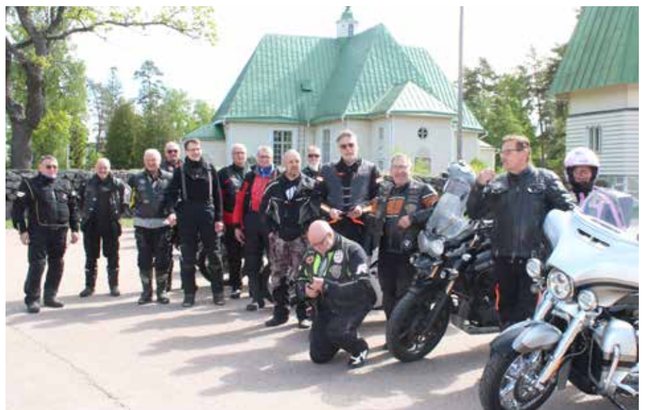
Virolahden kirkon parkkipaikalla meitä kokoontui 14 pyörää ja 15 osallistujaa kuvaaja mukaan lukien.