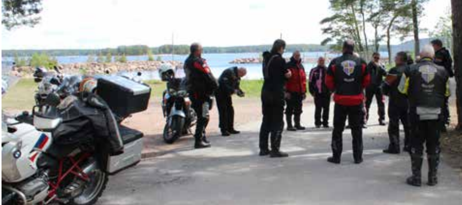
Ryhmämme kävi meren rannalla Hurpun merivartioasemalla, jossa pidettiin eteläisin rukoushetki.

Neljätoista moottoripyörän ryhmä GR-kerholaisia kokoontui helluntaina Virolahden kirkolle käynnistämään Itärajan rukousajoa koko Suomen puolesta. Virolahden kappeliseurakunta antoi kirkon käyttöömmme rukoushetkeä varten, kun varsinaista jumalanpalvelusta ei tällä kertaa sattunut olemaan, eivätkä muut lähiseurakuntien jumalanpalvelukset soveltuneet ajoaikatauluun.