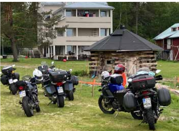
Larsmon savusauna tarjosi makoisat lölyt, ja välillä pääsi puhtaamaan virkistävään veteen.