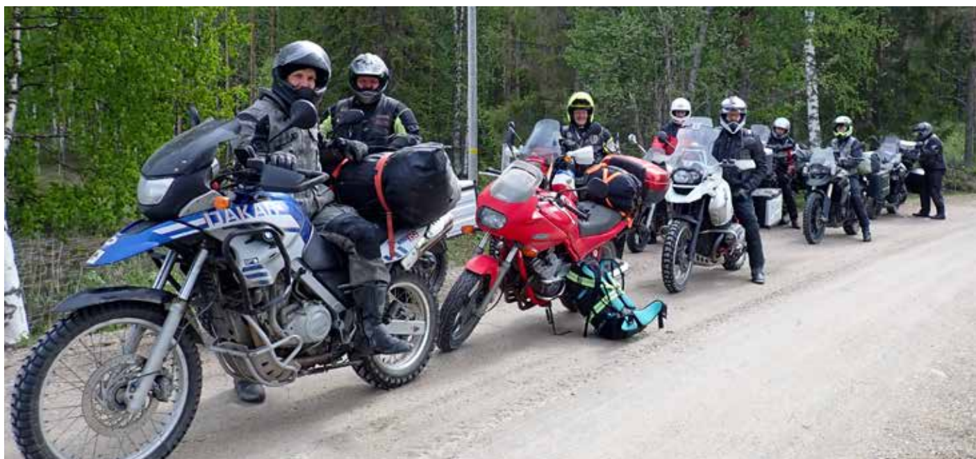
Itärajan rukousajon soraryhmä pienellä tauolla.

Teksti: Markus Karjalainen