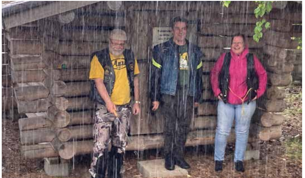
Ravakka kuuro keskeytti grillauksen hetkeksi Kuhmossa, mutta lopulta makkarat saatiin käristettyä.

Parikkalassa tuli tsekattua maailmallakin tunnettu erikoinen patsaspuisto. Vielä samana päivänä kaarsimme Myllyn Vanhat Autot -muse-