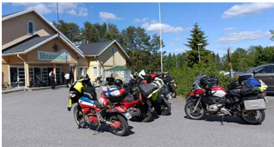
Kiteen vapaaseurakunta piti rukousajon porukkaa vierainaan lounasaikaan.

pyöräni on, mutta uskollinen kumppani kuitenkin. Matkaa kotoa Imatralle oli 370 kilometriä. Varsinainen rukousajo alkoi seuraavana päivänä.