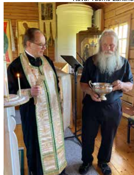
Lopuksi siirrytään ulos siunaamaan motoristit pyöriin.