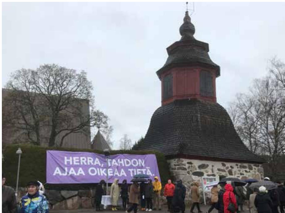
Liedon motoristikirkkoja vietetty 40 kertaa. Tänä vuonna sää ei ollut kauneimmillaan.

Sade tuo siunauksen. Näin voi ajatella, kun aurinkoisen äitienväiviikon ainoa sadepäivä ja sadepäivän ainoa sade osui motoristikirkon aikaan. Näin tahdon myös uskoa, sillä Liedon motoristikirkko on kuulunut ajokauden avaukseen koko motoristihistoriani ajan.