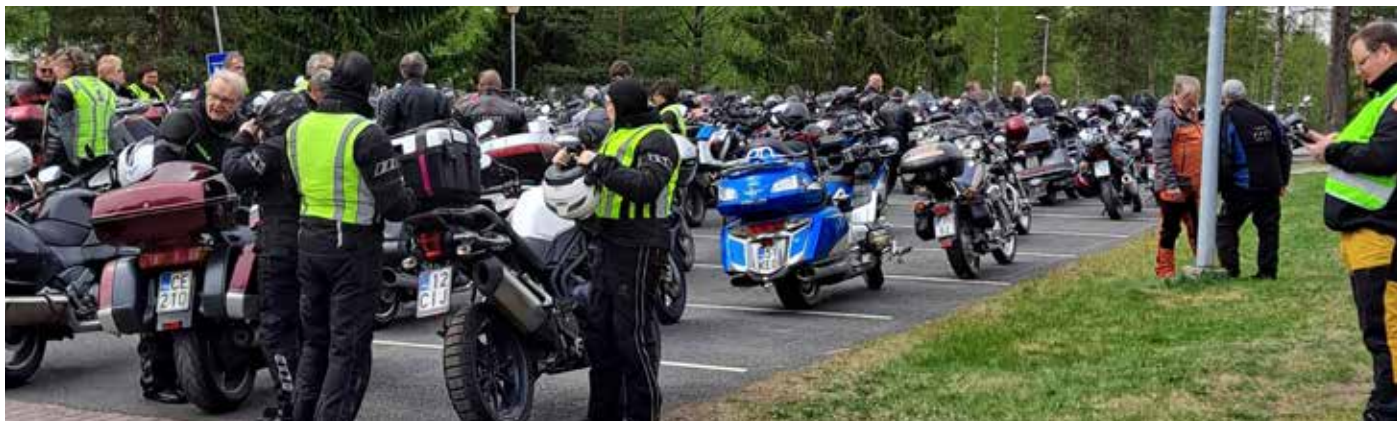
Perinteiseen Ylikiimingin motoristikirkkoon tuliin pitkienkin etäisyyksien takaa.

Jo perinteeksi muodostunut Ylikiimingin motoristikirkko kokosi helatorstaina motoristeja ja moottoriajoneuvoista kiinnostuneita naapurimaakunnista saakka. Paikalle saapui yli 180 prätkää ja noin 300 henkeä — eli kirkko oli lähes täynnä.