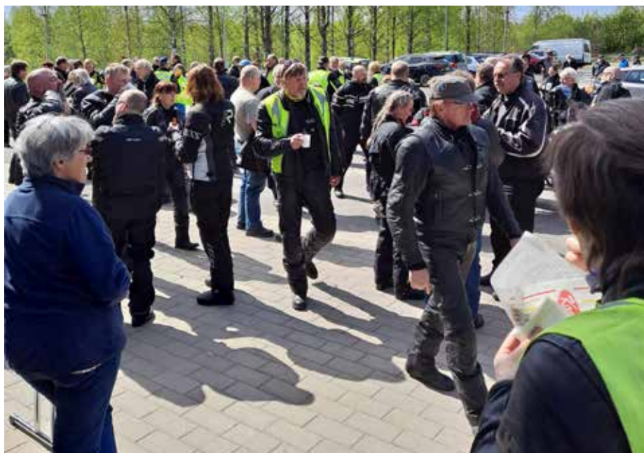
Kirkkokahvit tarjottiin kaikille, ja makkaraa sai ostaa lähetystyön hyväksi.