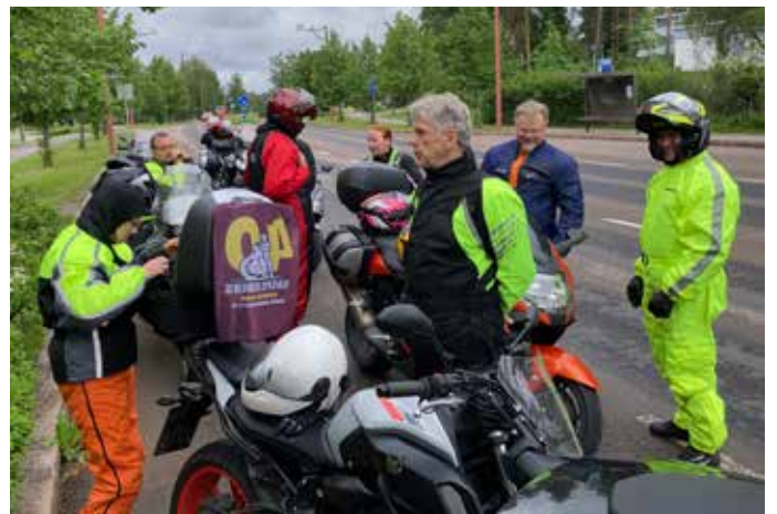
Reissun viimeinen päivä oli samalla ainoa sadepäivä. Tässä tauolla Kouvolaan lähestyttäessä.