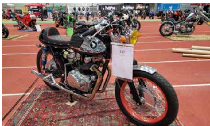
Japsistarat toivat näyttelyyn sekä vanhoja TT/RR-pyöriä että rakenneltuja legendoja!

Japsistarat-kerho oli tuonut paikalle näyttävän kokoelman vanhoja TT/RR-kiilppäpyöriä, joilla kaikilla oli ajettu legendaarisia kilpailuja. Itse legendat, pyörien kuljettajat, olivat myös paikalla, ja tarinaa riitti.