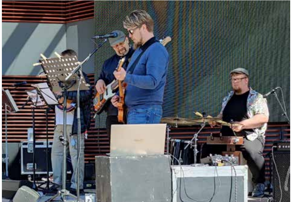
Musiikista vastasi Imatran seurakunnan ISRK-Light Orchestra.