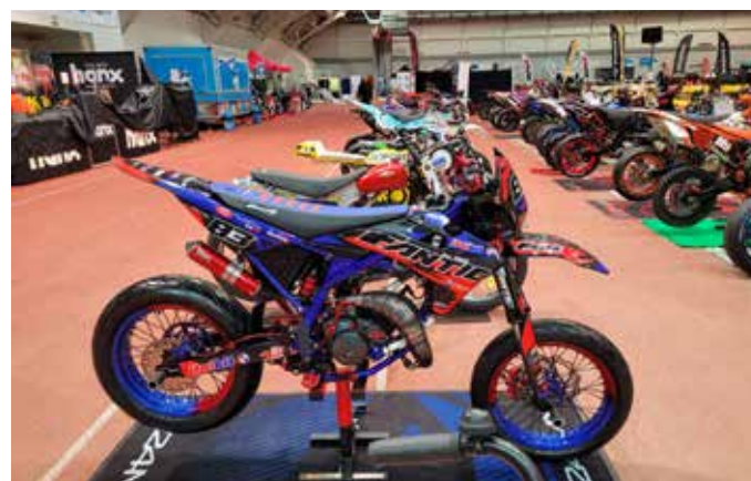
Näyttelyssä oli esillä rivi nuorten rakentamia supermotoja.