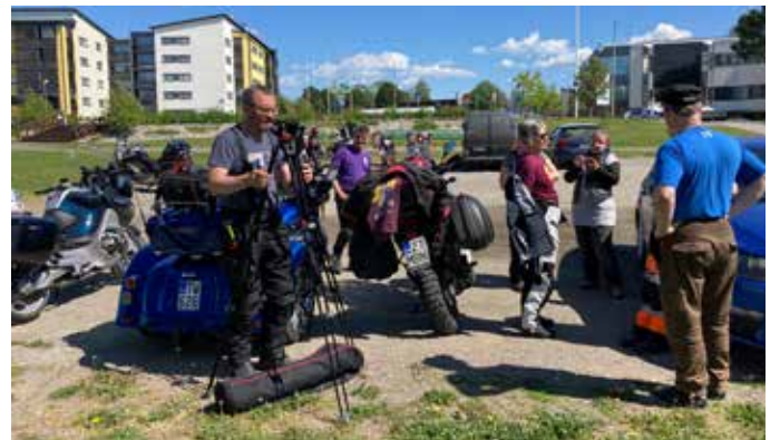
Viitasaaren rantaparkissa tavattiin ja kuvattiin.