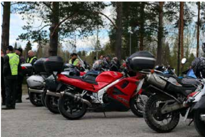
Kerimäelle kokoontui hyvänlainen joukko motoristeja aloittelemaan kautta.