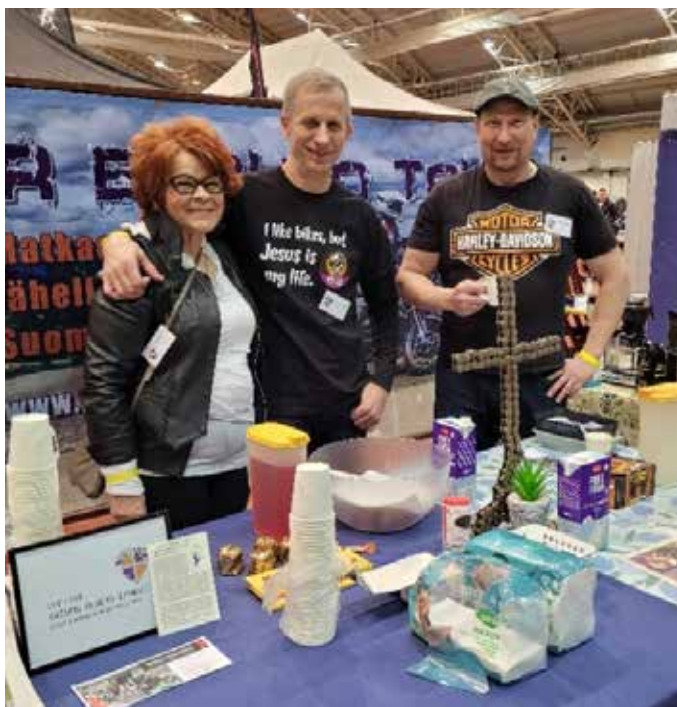
Gospel Riders Jyväskylällä on vuosikymmenien kokemus näyttelyosaston pidosta, ja intoa riittää.

Myös kahdella kristillisellä kerholla, CMA:lla ja Gospel Ridersilla oli omat näyttelyosastot. Gospel Riders -osaston iloiset talkoolaiset olivat valmiina vastaanottamaan osastolle tulijoita. Meillä on ollut tapana tarjota kahvit osastolla pistäytyville. Kahvitellun lomassa on luontevaa keskustella myös muista asioista, kuten kerhon toiminnasta lähialueilla ja motoristikirkoista. Lehteä ja Motoristiraamattua tarjottiin matkaevääksi.