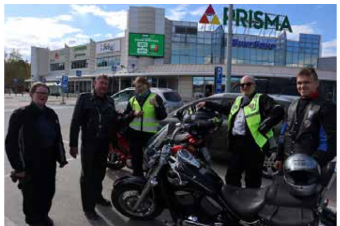
Pohjoiskarjalaiset kotimatalla Savonlinnan huudeilla.