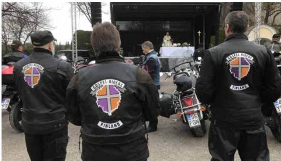
Gospel Riders on ollut aina edustettuna Liedossa, niin nytkin.