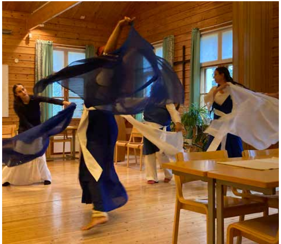
Ylistystanssiryhmä liittyi erikoisten vaiheiden jälkeen osittain mukaan Lapponia-ajoon. Sodankylässä gospelriderit saivat oman ylistystanssiesityksensä.

dimme nukkua yhden yön varaasamme mökissä Utsjoella.