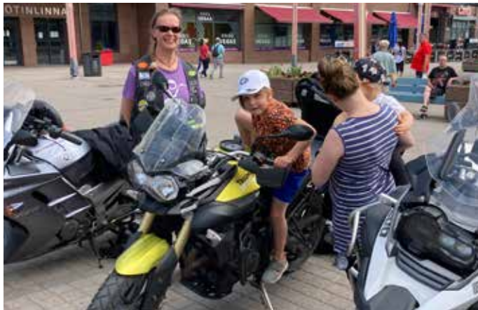
Lapponia-ajossa oli monenlaisia mielenkiintoisia kohtaamisia. Rovaniemellä muutamat lapset halusivat ottaa tuntumaa Minnan Triumphiin.

Reissusta olisi vaikka mitä kerrottavaa, mutta säilytän muistoja sydämessäni ja annan Herran tehdä työtään sisimmässäni. Innolla odottelen uusia reissuja ja seikkailuja Herran tiellä.