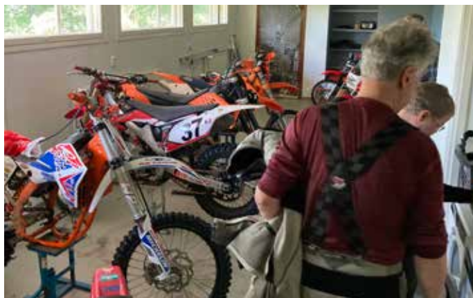
Gospel Riders –porukka sai ilokseen huomata, että paikka, jossa kerho perustettiin, on nykyään täynnä moottoripyöriä. Koulussa toimii Kanteleen Krossarit Ry.