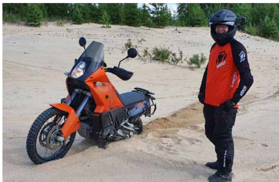
Joskus vain tulee raja vastaan.