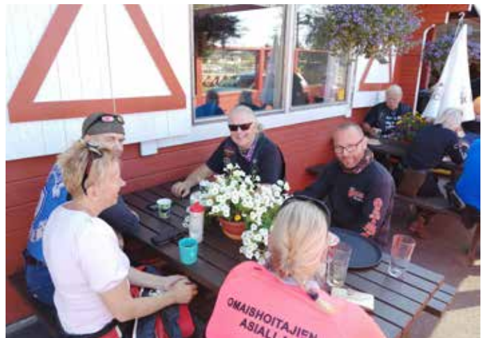
Osallistujia munkkikahvilla ajelun jälkeen.