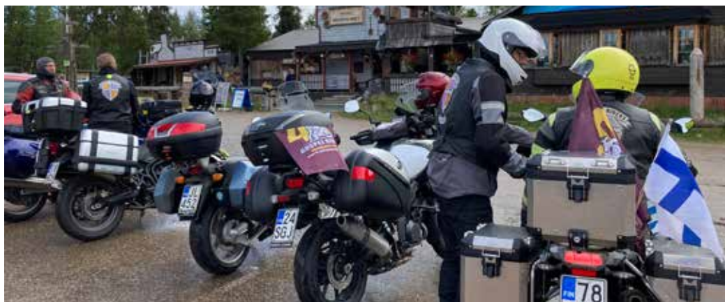
Sodankylän ja Kemijärven välillä kahviteltiin kullanhuuhtojen mailla Vanhassa vaskoolimiehessä. Pullavadiinkin olivat vaskoolin kaltaisia. Kirjoittaja kuvassa valkoisessa kypärässä.