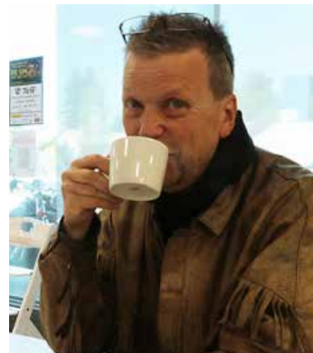
Arkka kahvitaulla 7xSF-kiertueella Tampereen Tesomalla vuonna 2018.