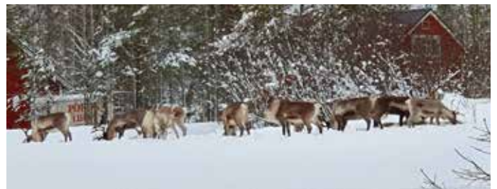
Porot kuuluvat kuvaan Lapissa niin jouluna kuin muulloinkin.