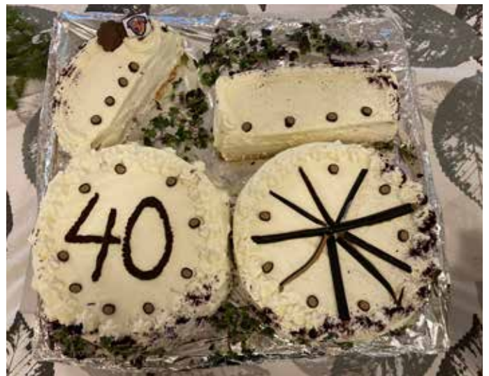
Lounastauolla kokousväkeä hauskuutti kerhon nelikymppistä muistuttava moottoripyöräkakku. Pyörän merkin arvuuttelu osoittautui sen verran vaikeaksi, että kakku päätettiin vain syödä pois.