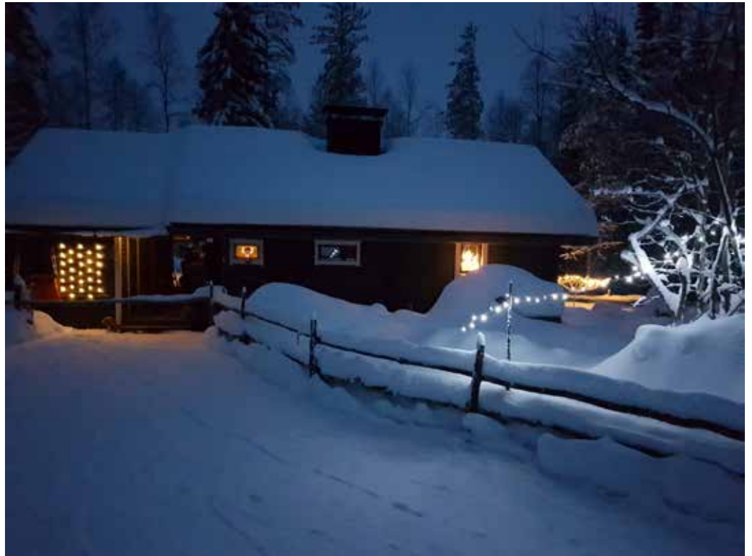
Lapissa kaamokseen tuovat valoa talojen jouluvalot.

Täällä on myös suuri uskomus joulupukkiin ja shamanismiin. Ne eivät suo turvaa, ja pelastusta niistä ei tule. Jeesus on ainoa pelastaja. Hän on tullut maan päälle tuomaan anteeksiannon ja pelastuksen kaikille, jotka haluavat ottaa hänet sydämeensä henkilökohtaisena Vapahtajana, Pelastajana ja Lunastajana. Jeesus tuli antamaan rauhan kaikille, jotka uskovat häneen.