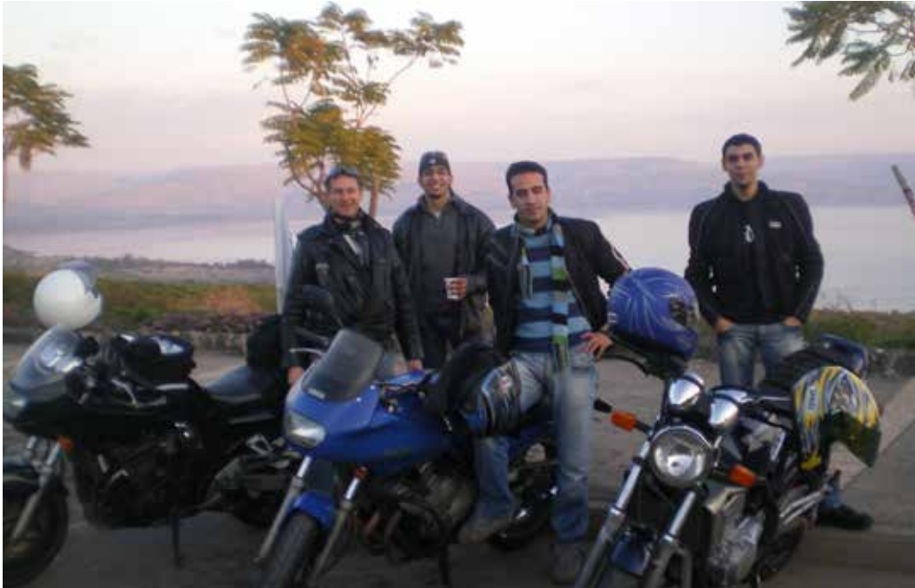
Gospel Riders Jerusalem jouluajelulla Genesaretinjärven rannoilla.

Lähetystyön vuosina olemme viettäneet jouluja milloin missäkin, ympäri maailmaa. Monissa perheellemme tuuissa kulttuureissa joulu ei ole välttämättä kovin iso juttu. Jaan joitakin mieleen painuneita kokemuksia jouluistani.