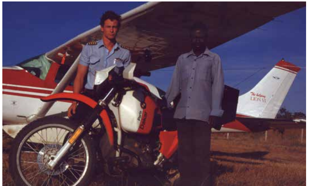
Tansaniassa lähdössä viemään joululahjoja, ensin kananpoikia ja sitten Raamattuja.