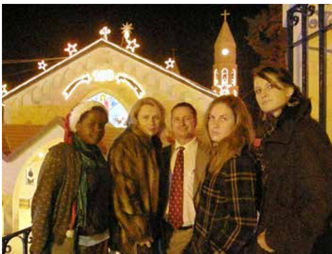
Rissanen perhe jouluna Betlehemissä.