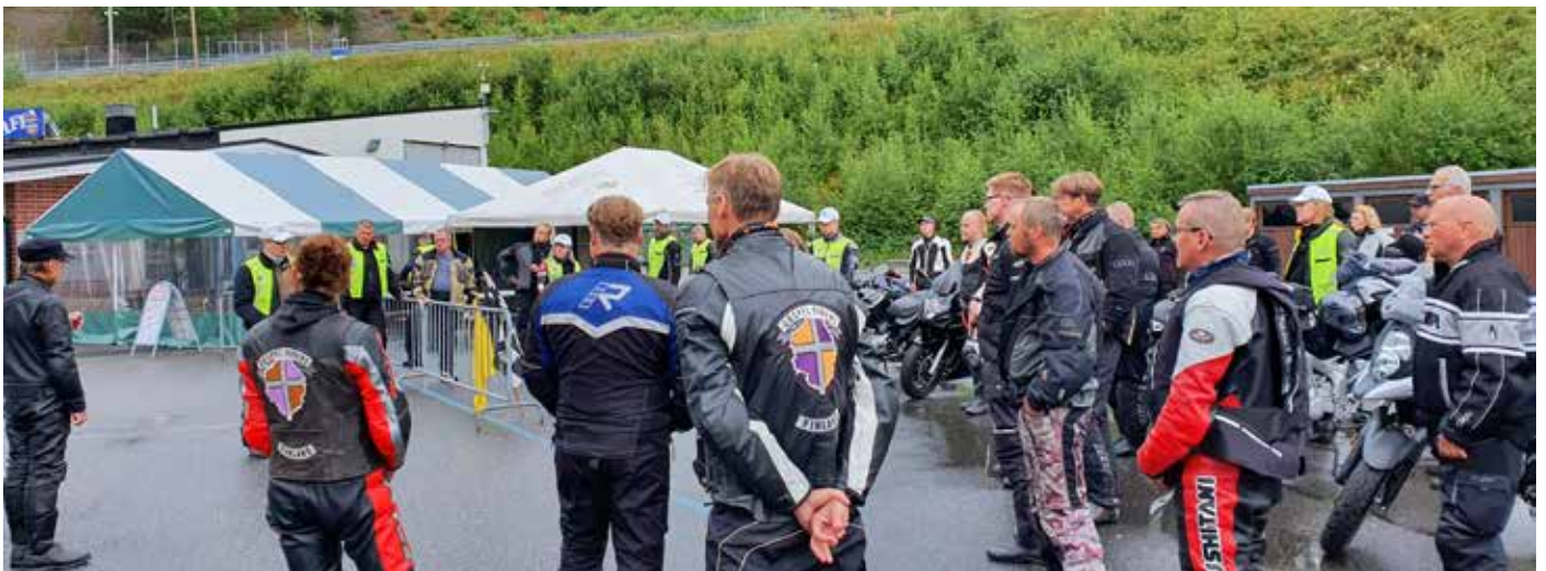
Ennen radalle menoa MP69:n kouluttajat pitivät rataifon GR:n ryhmälle.