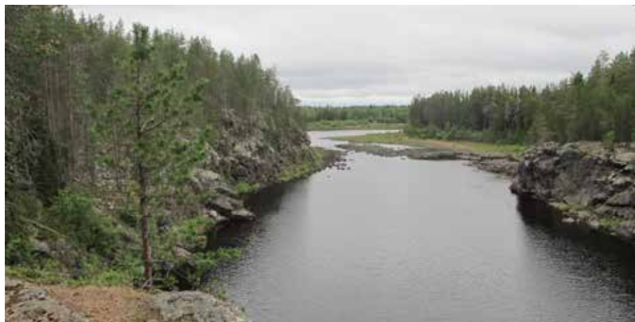
Kitisen varrella Askassa oli luontokohde, jossa pääsi ihaillemaan maisemia.

Olin miettinyt nukkuvani seuraavan yön Pielpajärven erämaakirkolla, mutta ajellessa ajatus alkoi tuntua kuolleena syntyneeltä: siinä tapauksessa pitäisi en-