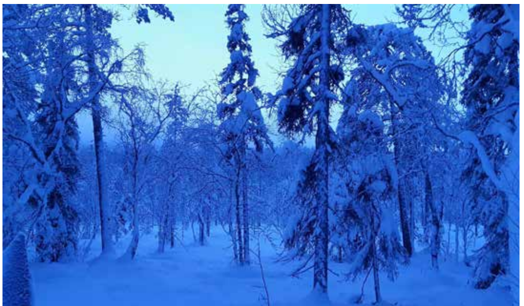
Jumala on siunannut Lappia erityisen kauniilla luonnolla.