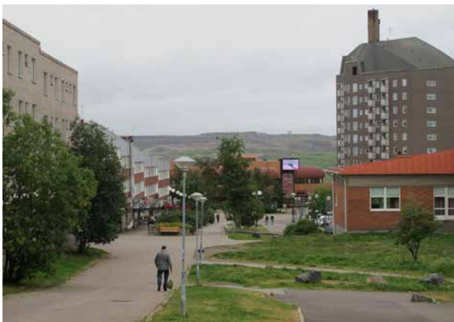
Kiirunan keskustanäkymä. Taustalla Kiirunavaaran kaivoksen maanpäällinen osa.

Kun selvisin kaivoskierrokselta takaisin majapaikkaani matkustajakotiin, minun oli aika lähteä jälleen tien päälle. Suunta oli Kemi-Tornio ja kerhomme Seitsemän kaupunkia tapahtuma.