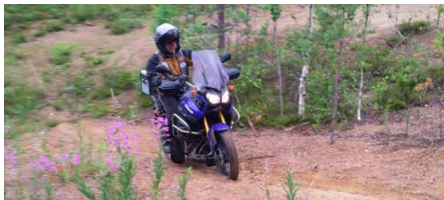
Jyrkkä mäki ja pehmeä hiekka – Esalle ei mikään ongelma