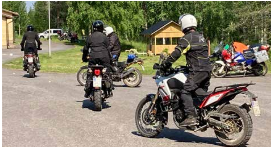
Suurin osa osallistujista aikoo jatkossa harjoitella itsenäisesti Tourilla opeteltuja asioita, kuten seisaaltaan ajoa ja painonsiirtoa mutkissa ja käännoksissä.