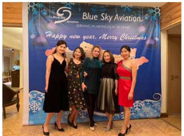
Lähetyslentäjien (MAF) Mongolian toimiston naiset joulujuhlissa.