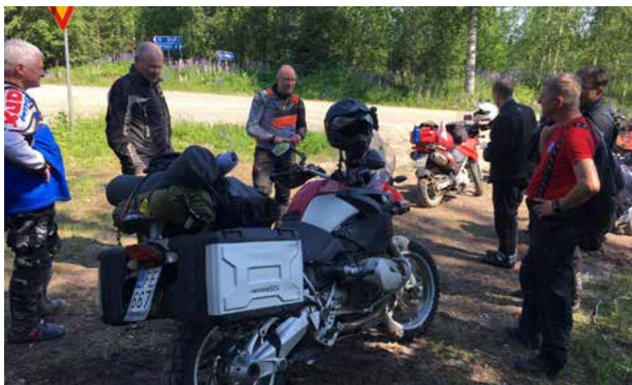
Siirtymät ajettiin matkatavaroiden kanssa.