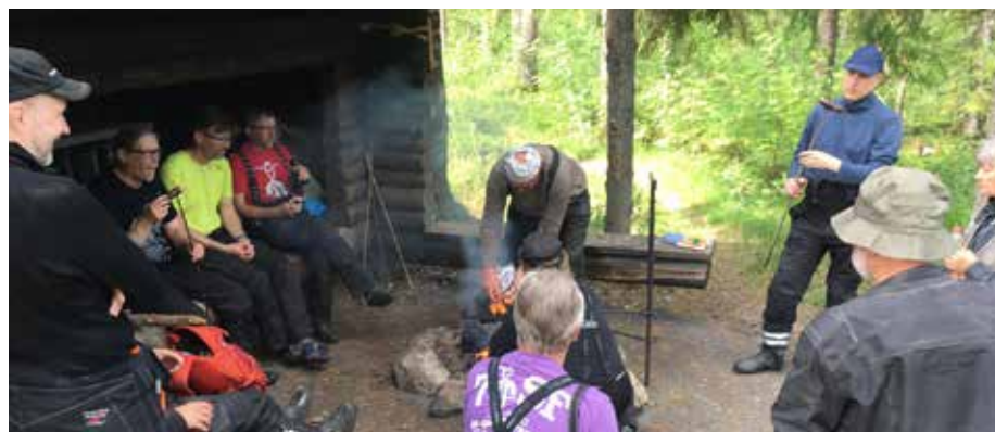
Yhteisöllisyys ja porukkahenki olivat huippua!