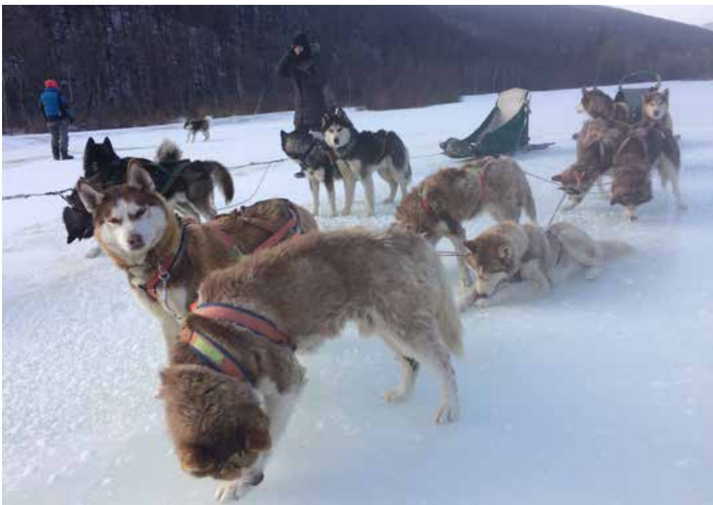
Jouluaaton ajelu Mongoliassa 27 asteen pakkasessa.

Yksi mainio jouluihin tapa- us jäi Mongoliasta mieleen. Kävin Ulaanbaatarissa päivällisellä pohjoiskorealaisessa ravintolassa nimeltä Pyongyang. Ravintolassa oli iso joulukuusi ja tähti sen latvassa. Pohjoiskorealaiset tarjoilijat esittivät ohjelmaa illan kuluessa. Normiasuna oli univormu, josta tuli mieleen sotilaan ja lentoemännän välimuoto. Asut vaihtuivat ensin kansallispukuihin, ja tarjoilijat esittivät maansa kansanmusiikkia ja lauluja, joiden sanoituksissa varmaan ylistettiin suurta johtajaa. Sitten asut vaihtuivat lyhyisiin kimalteleviin mekkoihin. Ensimmäinen he esittivät Ave Marian. Sitten oli vuo-