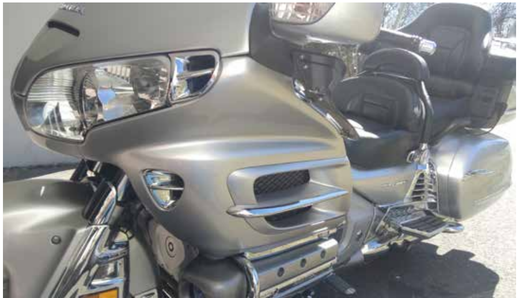
Honda Gold Wingin, matkustajien ja matkatavaroiden painoa ei ole helppo hallita, kun eturengas on tyhjä.

Jokaisella huoltoasemalla piti pysähtyä ja täyttää rengas piukaksi. Mukana oli varalla spray. Kyllä matka taittui. Pääsimme yhdellä täytöllä muutaman kymmenen kilometriä, ja rengas oli taas tyhjentynyt. Liimaus, teippaus ja paikkausspray eivät rengasta ehjänneet, mutta niillä nikseillä pääsimme kuitenkin kotiin.