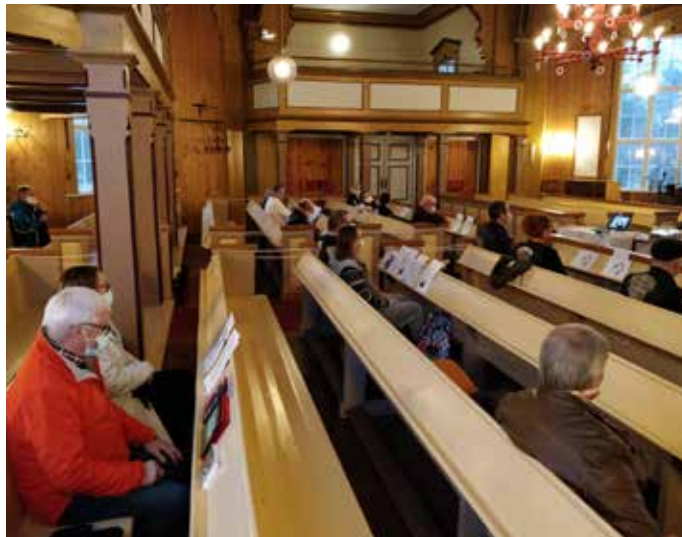
Sumiaisten kirkko tarjosi hyvät tilat turvavälein toteutettuun kiitoskirkkoon ja syyskokoukseen.