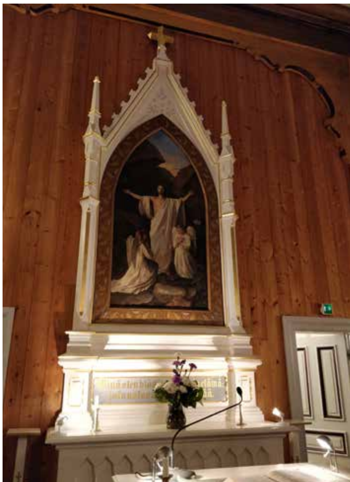
Kirkot kertovat omalla olemisellaan sen olennaisen. Kristus on tiemme Luojan luo.

Sumiaisten kirkko sijaitsee keskellä Suomea, kaukana kiihkeästä elämän vilkseestä. Sumiaisten väkiluku oli 1303 henkeä vuonna 2006. Seuraavana vuonna se liitettiin Äänekoskeen. Reilun tuhannen hengen kyläkeskus tarjosi siis kerhomme kokoukselle rauhallisen ympäristön, jossa etäisyydet toisiin oli helppo pitää. Tein pienen tutustumisretken kylälle, eikä ruuhkaa näkynyt missään. Vain muutama kauppa, joissa ihmiset hoitivat asioitaan.