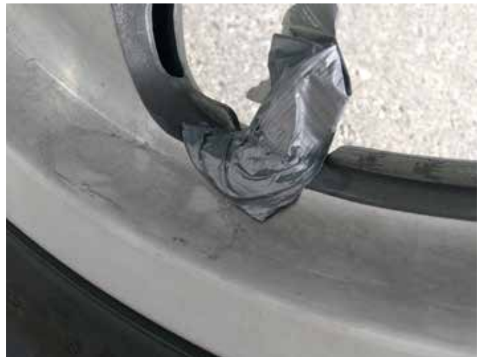
Kontaktiilma ja ilmastointiteippi pitivät paineen renkaissa vain vähän aikaa kerrallaan.