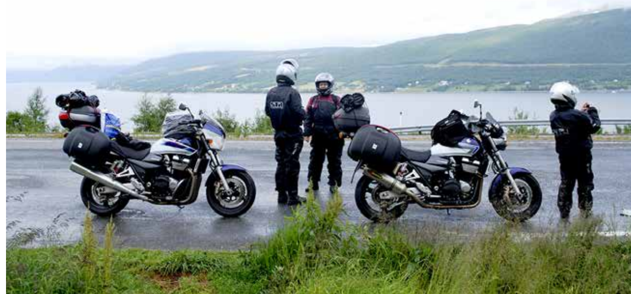
Vettä sateli, mutta tästä ei ollut enää pitkä matka Tromssaan. Olimme velipojan kanssa reissussa samantyyppisillä Suzuki GSX 1400 -nakumuskelipyörillä. Omani on jo mennyt kiertoon, mutta veljellä on Suitsansa edelleen toisena pyöränä.

Sitten tapahtui jotain, jota en ensin ymmärtänyt. Luulin, että navakka sivutuuli vempottaa pyörää tavallista enemmän — kunnes kaarteessa tajusin, ettei Suzuki oikein