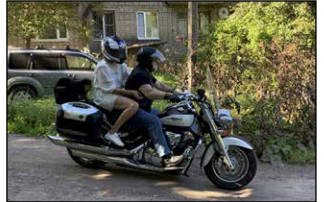
Viipurilaisella lastenkodilla valmistauduttiin seuraavana päivänä alkavaan kouluun. Myös lasten hiuksia leikkaamaan tulleet kampaajat saivat moottoripyöräkyttä.

Oli todella vaikea pitää kiinni säädetyistä yhdeksänkympin nopeusrajoituksesta. Reitin varrelle mahtui muutama taa- jama, muuten menimme keskellä korpea.