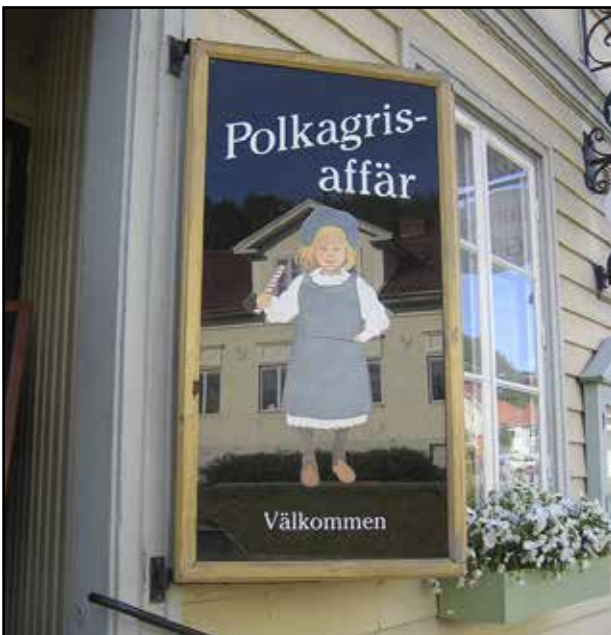
Polkagris-makeiset keksittiin Grännassa.

Jos Kalmarista ei kiinnostu ajaa vieläköän suoraan kohteeseen, on Ystad hienon ajoreitin päässä. Erityisesti Wallander-dekkarisarjaa seuranneita kiinnostanee piipahtaa viehättävässä kylpyläkaupungissa. Ystadista Halmstadiin on mahdollista ajaa 190 kilometriä Skånen rannikkoa pohjoiseen. EMC Rallyn paikka osuu matkan varrelle juuri ennen Halmstadin kaupunkia.