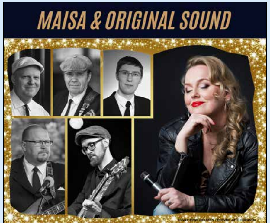
Maisa & Original Sound