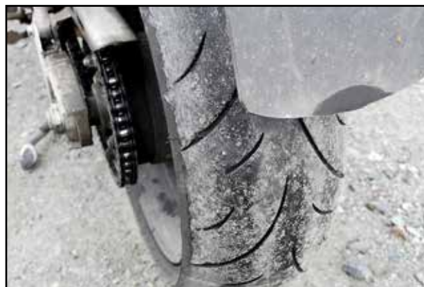
Pultti takarengaassa katkaisi etenemisen E6-tiellä Skibotnin ja Altan välillä. Ensiapu tilanteeseen tuli yllättävällä tavalla, ja lopullisen paikkauksen ansiosta renkaan saattoi ajaa normaalin elinkaarensa loppuun.

tyhjä, näin loivan alamaen päässä kaupan. Tyhjällä renkaalla rullasimme varovasti pihaan. Kaupalta löytyi sekä renkaantäyttöletku että paikkapulloja, hienoa!