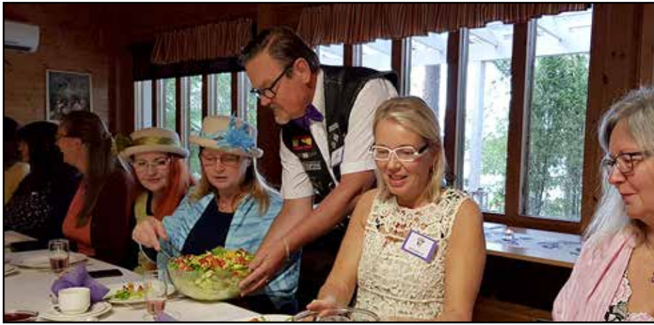
Komeat miestarjoilijat tarjoilivat illallisella paikallisia herkkuja.