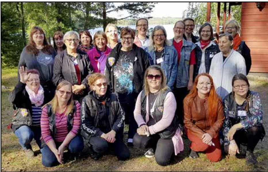
Iloisia pystymettäläisiä Valkealan Suvirannassa.

Iltapäivän liikuntatuokion, päiväkahvien ja saunan jälkeen alkoi valmistautuminen juhlaillalliselle. Aiempina vuosina illanvieton kohokohta on ollut missikisat. Niitä on järjestetty ensimmäisestä vuodesta lähtien. Naisten pystymettän missikisoissa on saanut nauraa vatsansa kipeäksi persoonallisille missi-