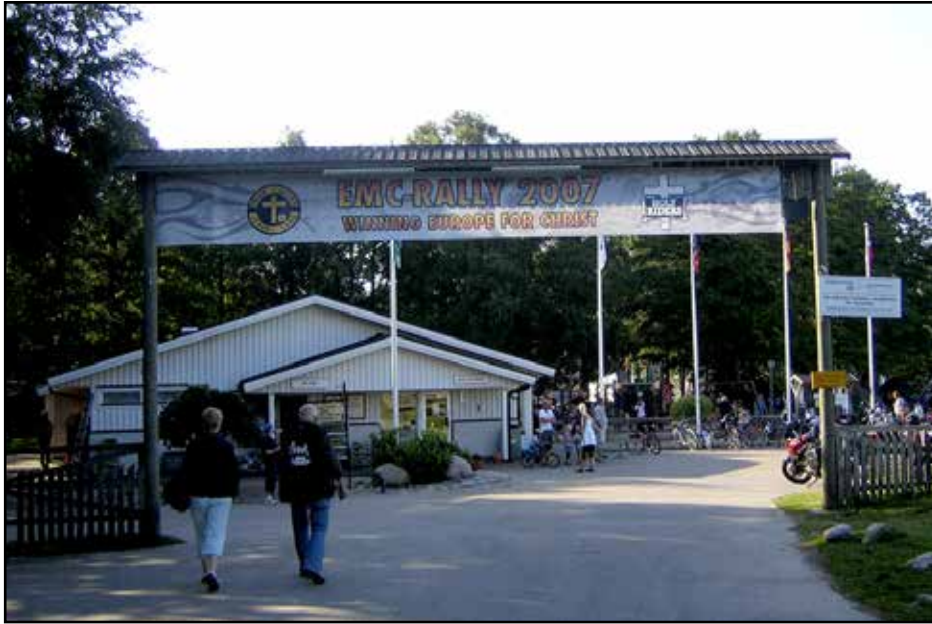
EMC Rallyn komea sisääntuloportti Halmstadissa vuonna 2007.

Palauttelin mieleeni muutamia itse kokeilemiamme tärppejä niille, jotka suunnittelevat reissua Halmstadiin.