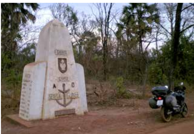
Senegalin ja Guinean rajamerkki.

seen, mutta hätätilanteessa ilmaista apua saavain. Miehet hakivat majasta palmunlehvistä kyhätyn vuoteen, jossa loppuyö sujui mukavasti taivasalla. Aamulla sai Hondakin vettä, ja ajo jatkui. Olin jo matkan ensimmäisenä päivänä kokenut todeksi Sanan lupaukset: "Hän virvoittaa minun sieluni. Hän ohjaa minut oikealle tielle nimensä tähden" (Ps. 23:3–4).