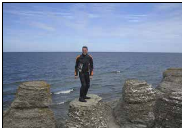
Öölannissa kuuntelemassa Itämeren aaltoja.