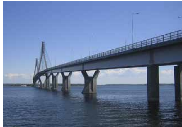
Kalmarin ja Öölannin yhdistää kuuden kilometrin pituinen silta.

nempiä teitä ja kääntyä valtatieltä ensin kohti Katrineholmia (tie 57) ja jatkaa sitten tietä 52 aina valtatie E20:lle saakka. Sieltä voi sitten pudotella pienempiä teitä kohti Vätterniä. Reitillä pääsee välillä keskelle ruotsalaista luontoa. Parin vuoden takaisella reissullemme olimme päästä liiankin lähelle. Ilman kovaa jarrutusta olisimme ajaneet päin kauriita.