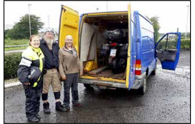
"Laupiaat samarialaiset" ja puhjennut rengas