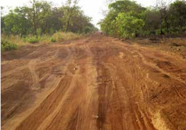
Tyypillinen länsiafrikkalainen tie.