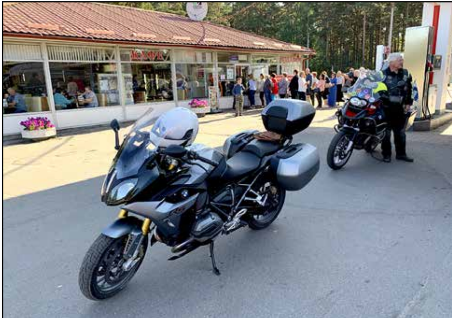
Bensa maksaa Venäjällä 60–70 senttiä litralta, joten ainakaan polttoainekuluihin matka ei tyssää. Lisäksi tarjolla on aivan loistavia mutkateitä — paljon!

Kokemus on osoittanut, että Venäjän rajamuodollisuuksiin pitää varata tunti. Päivän ohjelmasta oli sovittu, että lounas syödään Venäjän puolella. Heti rajan jälkeisessä kylässä on kohtuutasoinen lounaspaikka, osoite on Ulitsa Pobedy 21, Svetogorsk. Tietojeni mukaan tiellä Svetosta Viipuriin on ollut koko kesän tietöitä. Me olimme kuitenkin menossa Kaukolan ja Käki-