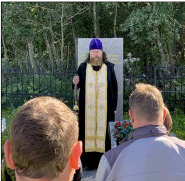
Isä V on tarpeen mukaan pappi tai moottoripyöräkerhon presidentti.

Kaikkein tärkeintä minulle on ollut oppia ruokoilemaan aivan uudella tavalla: "Tapahtukoon sinun tahtosi!" Täällä läheskään kaikki asiat eivät toteudu niin kuin on suunniteltu, mutta kaikki mitä tapahtuu, on parasta juuri niin, kuin se toteutuu.