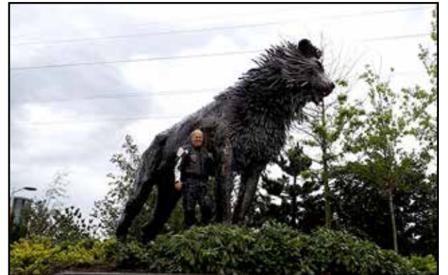
Narnia-puisto ja Aslan-leijona