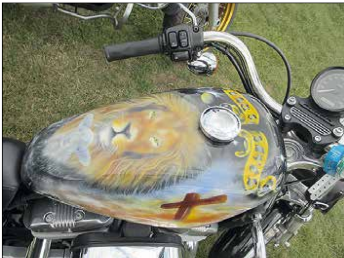
Pyöräbongauksia: Juudan leijona tankkiin maalattuna.