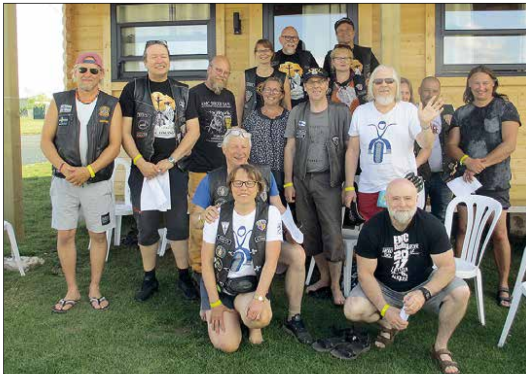
Tässä kuvassa ovat melkein kaikki EMC-rallissa mukana olleet suomalaiset.

Matkamuistona Lontoosta sain Helmiin aivan spesiaalinen käynnistysysteemin: pieni "musta laatikko" ulkona ilma-aukosta. Siihen sulake, ja avain virtalukkoon. Ja sitten menoksi kohti Eveshamia ja EMC-rallia!