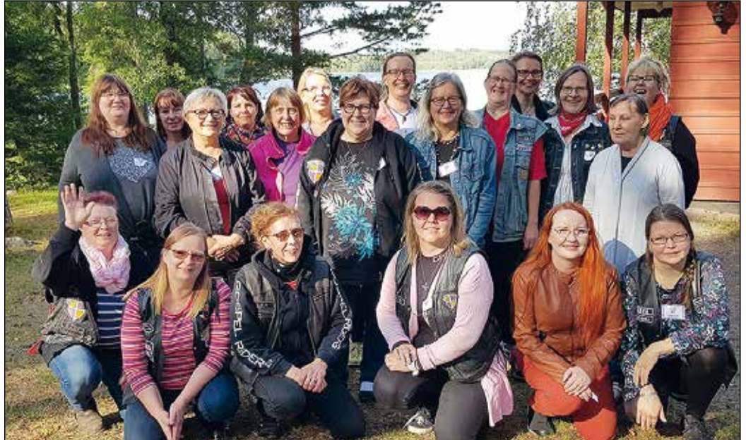
Iloisia pystymettäläisiä Valkealan Suvirannassa yhteiskuvassa.

Tänä vuonna ei ollut kisoja ja tiukkaa äänestystä. Missikisojen sijaan Kaakon naiset kehittivät uuden Miss Hangaround -tittelin