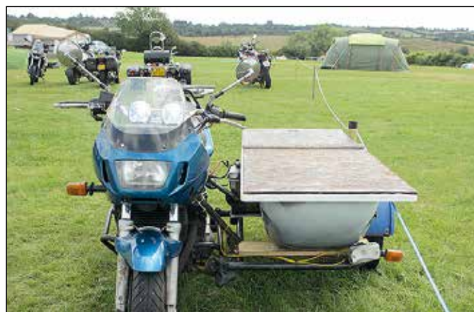
Pyöräbongauksia: kylpyammesivuvaunu. Kätevä pysähtyä pesulle!