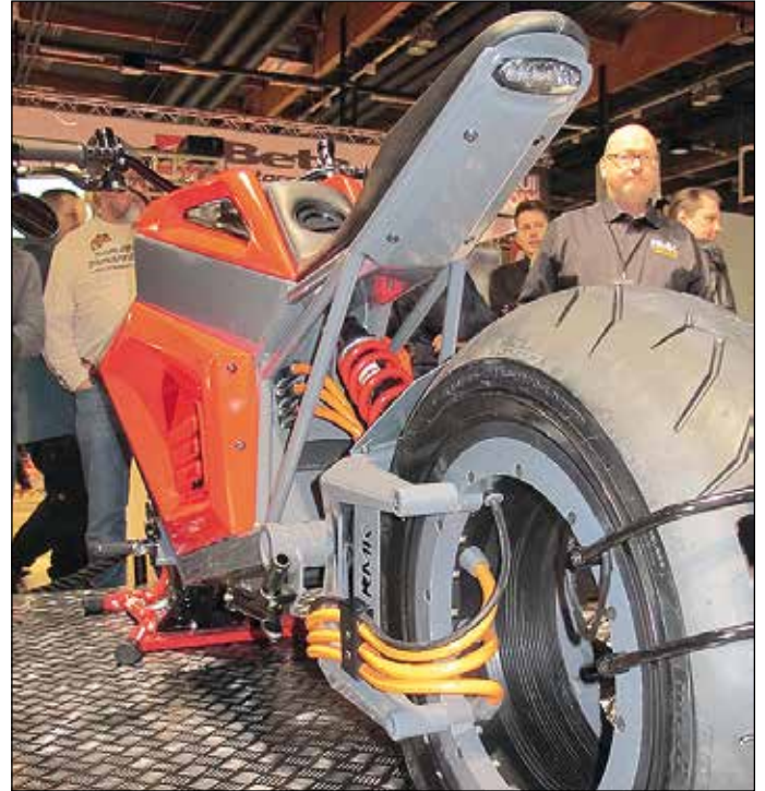
Moottori on oikeastaan koko takapyörän vanne kokonaisuutena.

Tavallista motskaria E2:ssa on oikeastaan etupää haarukoineen