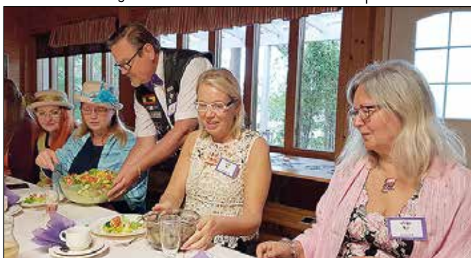
Komeat miestarjoilijat tarjoilivat illallisella paikallisia herkkuja.