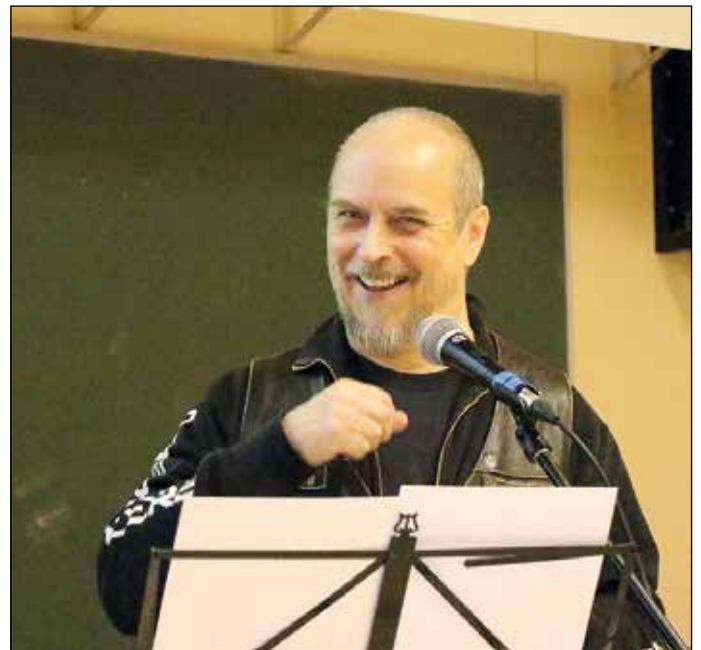
PeeTee osaa olla positiivisesti kannustava ja innostava.

Lähimmäisen rakkaus, kunnioitus ja läsnäolo kuvaavat hyvin opetuksen antia. Kukaan ei ollut pitämässä luentoja oikeista menettelytavoista. Jokaisella mukana olevalla oli mahdollisuus jakaa toisille omia kokemuksiaan kerhossa toimimisestaan. Kaikki saivat näin kuulla eläviä esimerkkejä kokemuksistaan aluetoiminnassa eri puolilla Suomea. Kuultiin käytän-