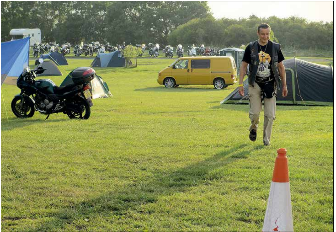
Leirintäalueemme sijaitsi Spitten Farm'in viheriöllä Lenchwoodin kylässä, noin 40 kilometriä etelään Birminghamista.