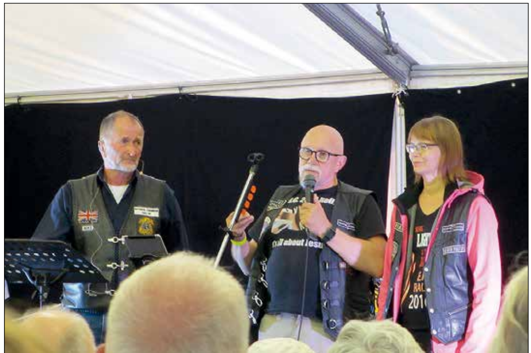
Iltilaisuus veti runsaasti väkeä Haaparannalla, jonne tapahtumamme laajeni sujuvasti. Vastaanotto kaikissa kolmessa kaupungissa oli oikein hyvä.