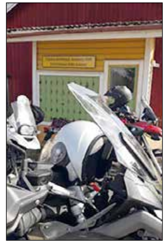
Kalvolan Taljalassa on harvinainen postikoppi vuodelta 1946.

Karin kevätkieppi on muutama viime vuosina järjestämäni kevyt hiekkatieajelu Kanta-Hämeessä. Viime vuonna kevätkieppi ajettiin Kalvolan ja Tammelan alueilla. Ajelu on Gospel Riders Hämeenlinnan alueen toimintaa ja käytännön vastuu on kerhomme enduroajaostolla. Koska kerhon jäsenet ovat eri nopeusluokkiin sijoittuvia, oli kieppiä varten lähtijät jaettu nopeaan ja maisemaryhmään. Se aiheutti aluksi hämmennystä, mutta osoittautui oivaksi ratkaisuksi, sillä muutamat "hiekkatie-expertit" kääntävät kaasukättä reippaasti, kun itse olen rauhallisesti ajeleveä. Nopealla ryhmällä oli osittain pienempien teiden reitti alkupuolella matkaa ja maisemaryhmällä oli yleensä alussa tasaisemmat tiet. Ajelutauot pidimme kuitenkin samoissa paikoissa.