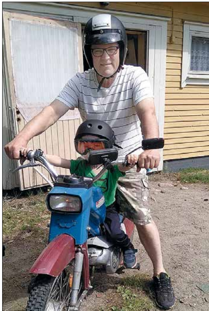
Ari-ukki, pikkumies ja Pappatunturi.

Mieleeni palaavat ensimmäiset muistot motskakyydeistä isän kanssa 1950-luvulla. Silloin jo vanha ja loppuun ajettu DKW:mme oli