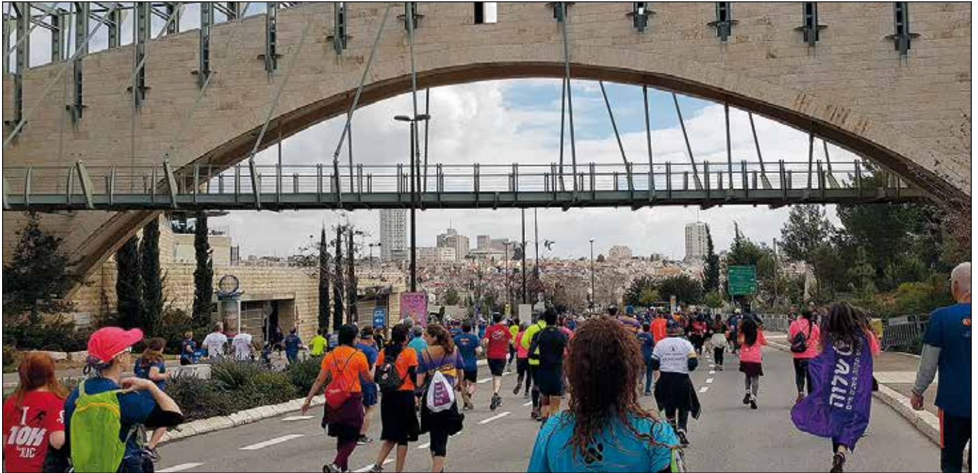
Meininki oli rentoa ja edessä siinteli Daavidin kaupunki.