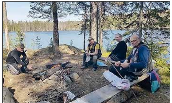
Kanajärven nuotiopaikalla maistuivat niin omat eväät kuin elävän tulen lämmössä paistetut makkaratkin.

Kuurilan junaonnettomuuden muistomerkki muistuttaa Suomen rauhanajan suurimmasta junaonnettomuudesta.