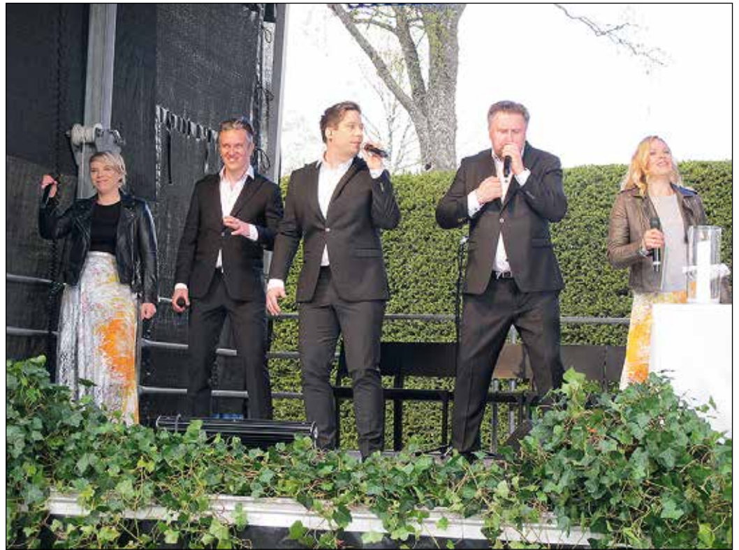
Huikkeen lahjakkaan Club for Fiven musiikki oli motoristijumalanpalveluksessa hieman tavallisesta poikkeavaa.

– Saimme venäläisen nettisivuston kautta tietää, että Pietarista on lähdössä motoristiryhmä Suo-