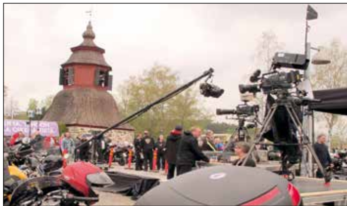
Myös YLE oli motoristikirkossa paikalla. Se televisioitiin 2.6. klo 10.

matkaa vain paikasta toiseen. Näkyvän elämäntien vierellä kulkee toinen, sisäinen tie. Se ei ole yhtä näkyvä, mutta se on yhtä todellinen. Sen matkan käymme omissa sisäisissä maisemissa ja huoneissa, hän sanoi.