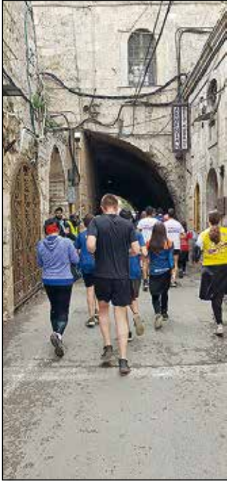
Reitti kulki Vanhankaupungin armenialaiskorttelin läpi.

linen, kun juoksupäivänä oli ihan teellinen kevät, puolipilvistä ja noin 15 astetta. Lähtöportille oli kilometrien pitkät jonot, mutta portin läpi päästyä oli tilaa juosta. Mukana kymppillä oli paljon kimpaporukoita ja myös joukko, joka juoksi työntäen pyörätuolissa olevia vammautuneita nuoria. Vaikka pitkät mäet tuntuivat raskailta, jotenkin matka joutui massan mukana. Reitin varrella oli myös paljon kannustajia ja musiikkiryhmiä.