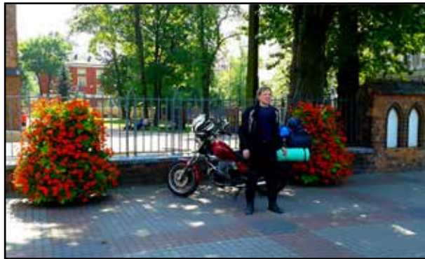
Varsova, ensimmäinen aamu Pyhän Florianin kirkkomailla.

neinä varsovalaisten motoristien käytöstä — he loistivat poissaolollaan. Kiovassa riittää, että pysähtyy edes hetkeksi, ja heti joku motoristi ilmestyy kuin puun takaa tarjoamaan apua. Varsovalaiset eivät tunnu välittävän, jatkavat vain tyyliä matkaansa pois näkyvistä. Pyörää ei siis saatu käyntiin ja piti keksiä jotakin. Onneksi sil-