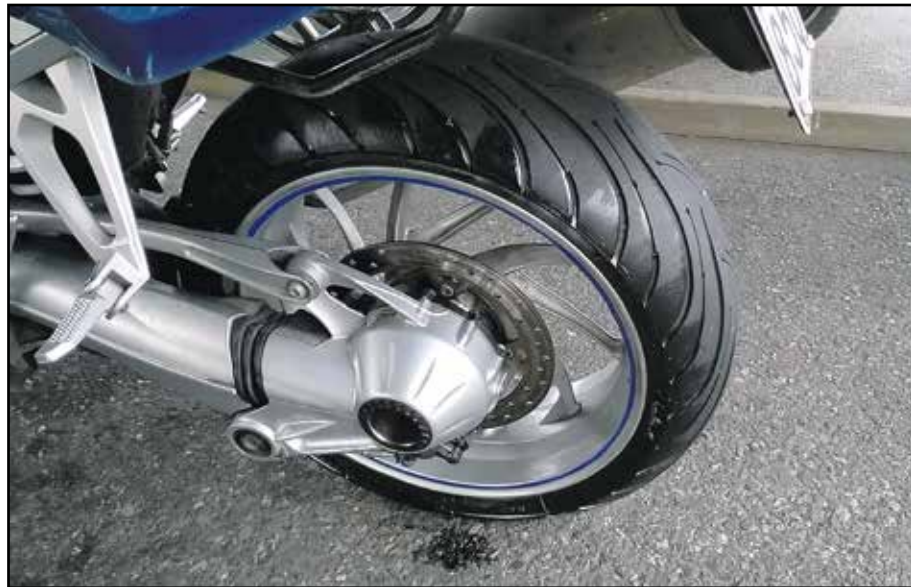
Öljyinen takarengas on aina vaarallinen.

edeltävänä iltana. Vähän siinä pyörää RM Heinon pihalta ottaessani ihmetelin kosteaa jälkeä takapyörän kohdalla, mutta innostukseltani otaksuinsen olevan vain pesuvesijäämiä — olihan takapyörä ollut todella rasvainen ja likainen hajomisen jäljiltä.