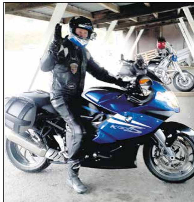
Vaihtopyörä alla, kuvaus voi alkaa.

pyörä vaihtuu siihen lainattuun, joten sielläkin oltiin varmasti lopulta ihan tyytyväisiä.