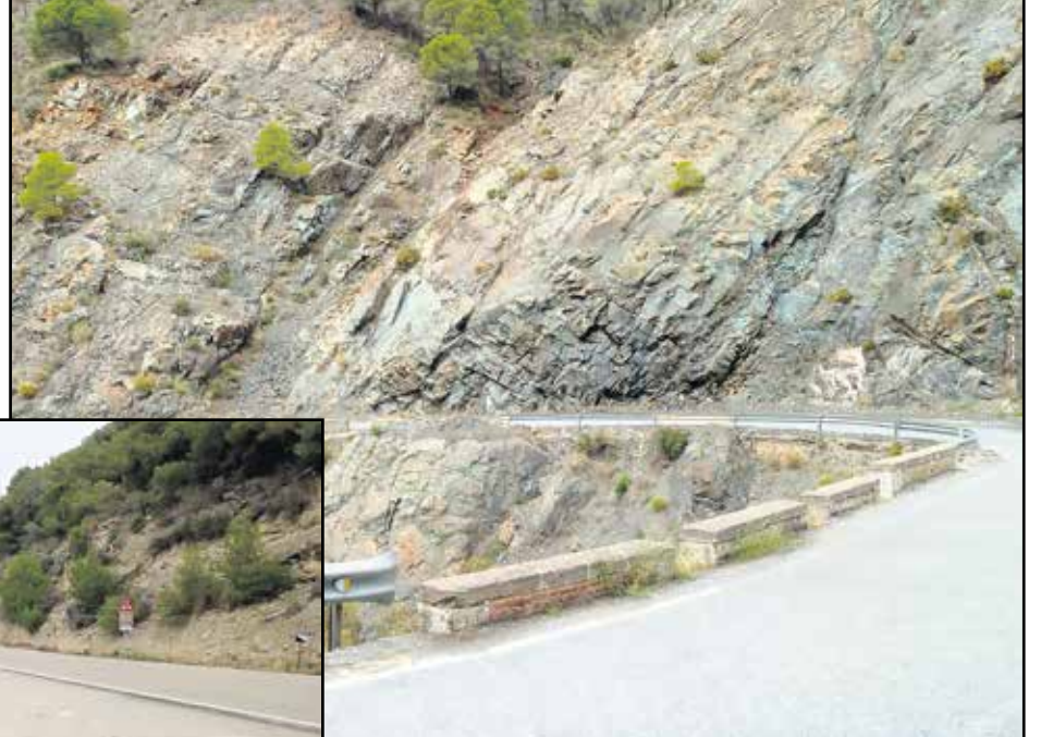
Jyrkät kallionseinät toivat matkaan oman jännityksensä, samoin liukas asfaltti.

kailtu, liukas ja rökkyinen, menee ylös ja alas, neulansilmästä toiseen, yli tiilisten kaarisiltojen. En suosittele tätä pätkää vuoriteiden aloittelijoille, ja kokeneenkin konkarin on syytä olla varuillaan. Puiden neulasia on paikoin puolen tien leveydestä, paljasta on vain kapea rantu keskellä. Neulasmaton peittävä asfaltti on liukas! Ruuhkaa ei ole. Ainoat muut liikkujat, Ducati ja BMW, menevät ohi kuvaustauolla. Muita kuljijoita ei reilun 20 kilometrin matkalla näkynyt.