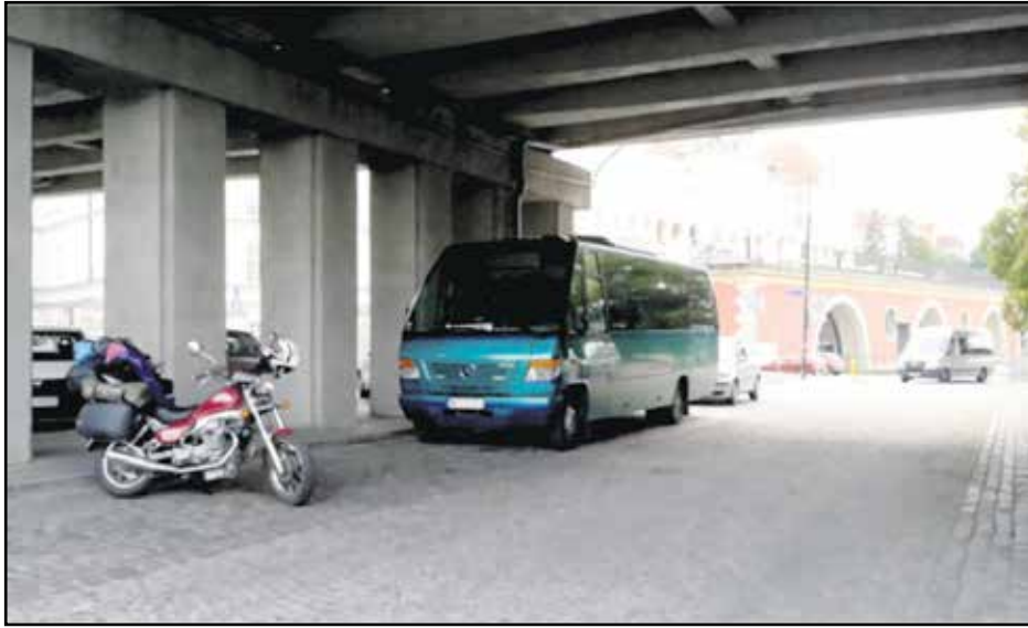
Improvisoitu korjauspakkamme Śląsko-Dąbrowskin silta Varsovassa, taustalla Puolan kuninkaiden linnan kompleksi.

Elettiin heinäkuuta 2014. Euromaidanina tunnettu Ukrainan valtakumous muutama kuukausi aiemmin oli vapauttanut maata paljon ja allekirjoittaneen erään suomalaisen maa-firman kehitystehtävistä. Olin asunut yli vuoden Ukrainassa ja tutustunut sinä aikana tulevaan vaimooni. Nyt edessä häämötti epämääräisenä tulevaisuus ja ihan ensimmäisenä moottoripyörän haku-reissu Ukraina.