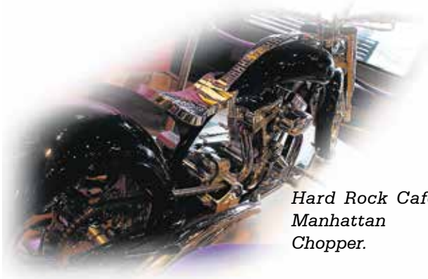
Hard Rock Café Manhattan Chopper.

kauniissa vuoristomaisemissa. Tapaamamme kanadalaiset kertoivat ajavansa tien joka vuosi ja pitävänsä sitä Amerikan mantereeseen kauneimpana reittinä. Tie on ihanteellinen moottoripyöräilyyn, asfaltti on tasainen eikä liikennettäkään juuri ole. Toukokuun aurinkokin lämmitti jo mukavasti. Se oli ajonautintoa!