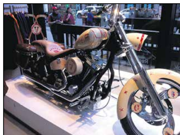
NH Chopper Manhattan New Yorkissa.

Seuraava kohteemme oli Savannah. Olimme sielläkin pari päivää. Savannah oli todella kaunis