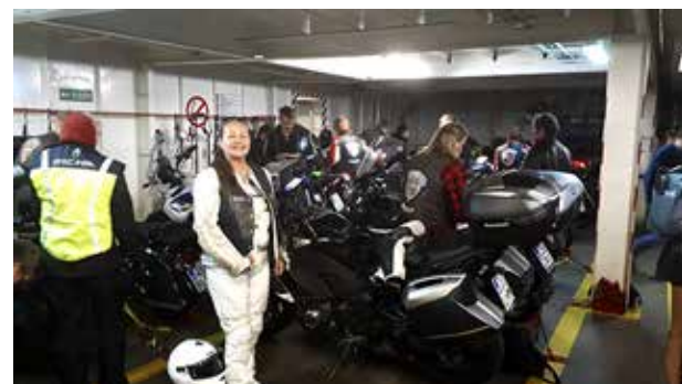
Lautta on tulossa satamaan ja motoristit ovat jo haarniskoissaan.