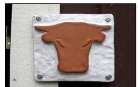
Hämeen Härkätien tunnus on härän pää.

Hämeen Härkätie on nykyään pääosin asfalttietä. Hiekkatietä on eniten Rengon alueella. Moni motoristi välttää