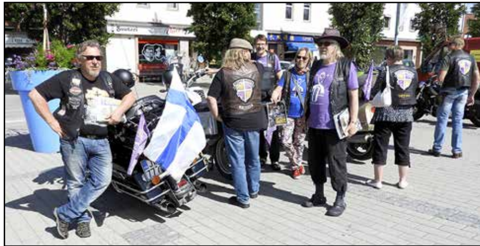
Gospel Riders -kerho saapuu Järvenpään 28.-30.6.2019 operaatioon 7 kaupunkia.

Moni gospelrideri haluaa edelleen evankelioida maattamme moottoripyörän selästä. Tämä lehti on täynnä kertomuksia siitä, että motarin satulakin voi olla kuin saarnapöytä. Meille 7xSF-tapahtuman vetäjille on jäänyt aiemmilta vuosilta se käsitys, että monilla paikkakunnilla halutaan meidät paikalle vieläkin, ja yhä uudelleen. Ja