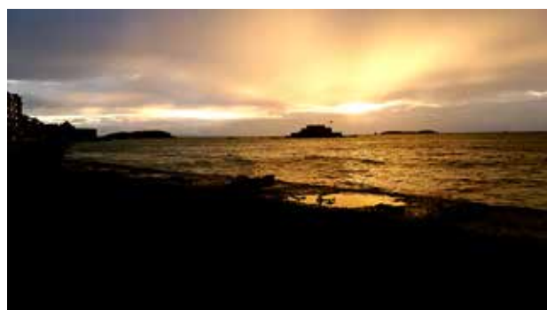
Auringon lasku Saint Malo, Ranskassa.