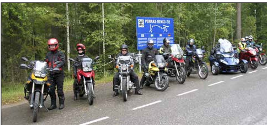
Matkan varrella pidettävillä tauoilla voi vaihtaa ajatuksia ajokeista ja matkasta. Ajelu on Gospel Riders -kerhon Hämeenlinnan alueen toimintaa.

Pyhiinvaellukselle voi lähtee yksin tai yhdessä. Vaeltaja voi monella tavalla: kävellen, pyöräillen, veneellä matkaten tai oman valinnan mukaan — vaikka moottoripyörällä. Pyhiinvaellukseen kuuluu olennaisena