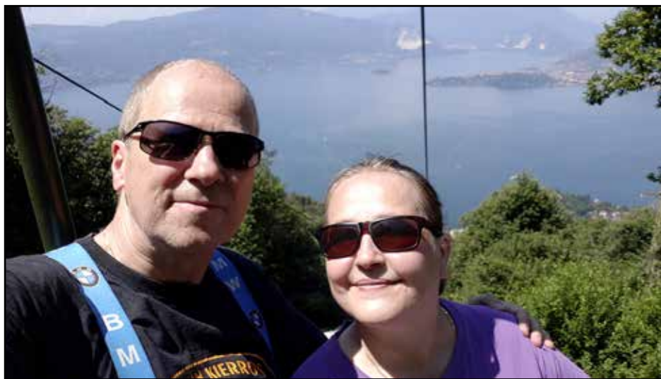
Baveno ja köysiratomatka nähtävyyksiä katsomaan.

Ensimmäinen etappi vei meidät Lago di Mag-