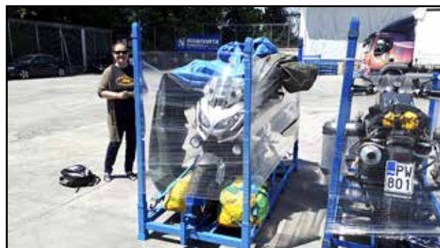
Niinivirran terminaali, Milano.

Hieno helmihäämatkamme lähestyi loppuaan. EMC-viikonloppuna tapasimme parin päivän aikana monia kristittyjä motoristeja eri puolilta Eurooppaa ja aina Etelä-Afrikkaa