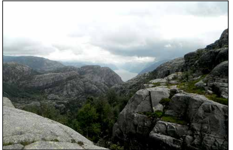
Luojan luomaa luontoa Saarnatuolilta nähtynä.

ihmisille Herramme Jeesuksen Kristuksen sovitustyön kautta. Se on tarkoitettu myös saarnaajalle. Saarnatuolissa hänkin saa olla hoidettavana.