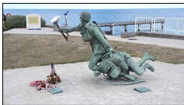
Omaha beach, Normandian maihinnousun paikka.

miseen lomakylään. Seuraavien kuuden päivän aikana teimme sieltä retkiä Genevejärvelle ja Mont Blancin suuntaan. Alueella oli niin paljon nähtävää, että päiväreisut pysyivät mukavan lyhyinä.