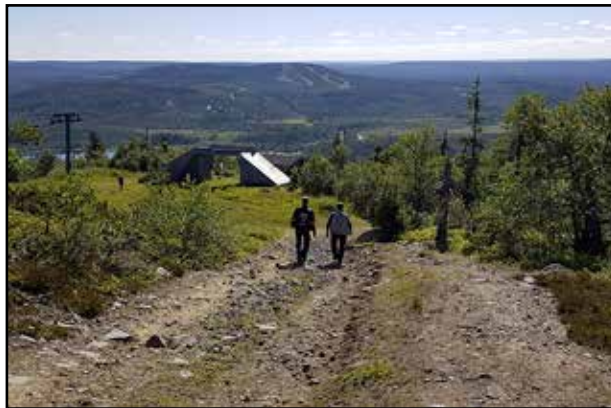
Iso-Syötteen jylhissä maisemissa.

Seuraavana päivänä oli edessä siirtymätaival Suomussalmelle. Siinä välissä ehdimme tavata Itä-Suomen 7xSF-ryhmän ja pääsimme osal-