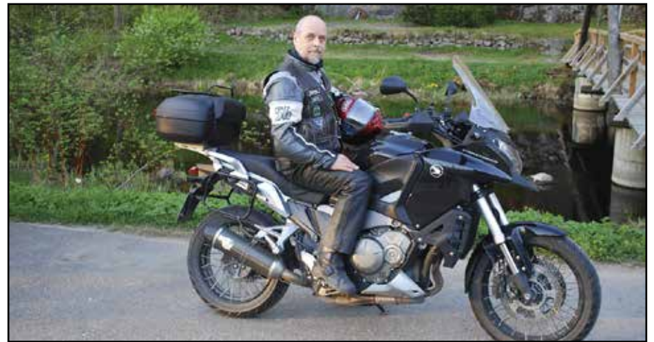
PeeTee ja Honda

Jeesuksen sanat eivät tietenkään tarkoittaneet tämän tason asioita. Ne olivat kuvakieltä, jota