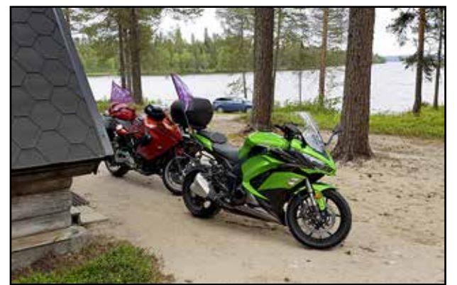
Lomakeskus Himmerkin mökkimme kirkasvetisen Kitka-järven rannalla.

tutustua paikalliseen grillikioskiin. Muutamat puolankalaiset ovat kehittäneet pessimismistä matkailuvaltin ja grillillä saa siitä lyhyen opitun. Aate kiteytyy paikalliseen lausahdukseen "mitäpä se hyvejä". Aiemmin kylällä vietettiin pessimismipäiviä, mutta nykyään aate