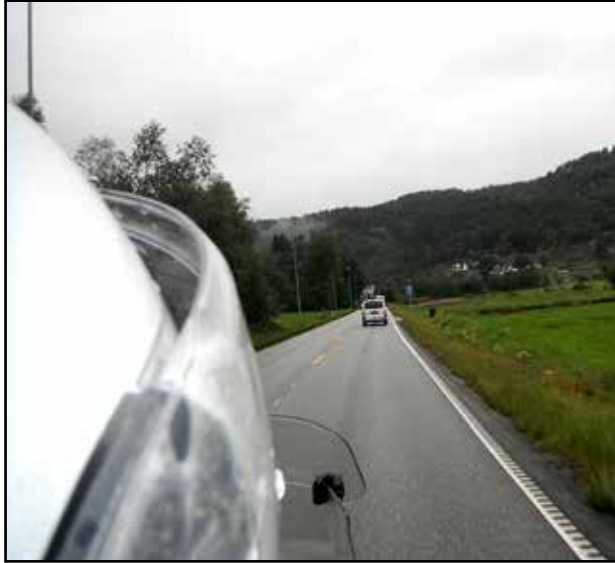
Pitkä matka saarnatuolille.

Ennen kuin lähdimme matkaan, sitä oli valmisteltu jo hyvän aikaa. Niinhän oikean saarnan kanssa toimitaan. Kävi kuitenkin niin, että yksi asia jäi aivan viime tintaan — polttoaineen tankkaaminen. Lisäksi ajoitin hermostuksissani