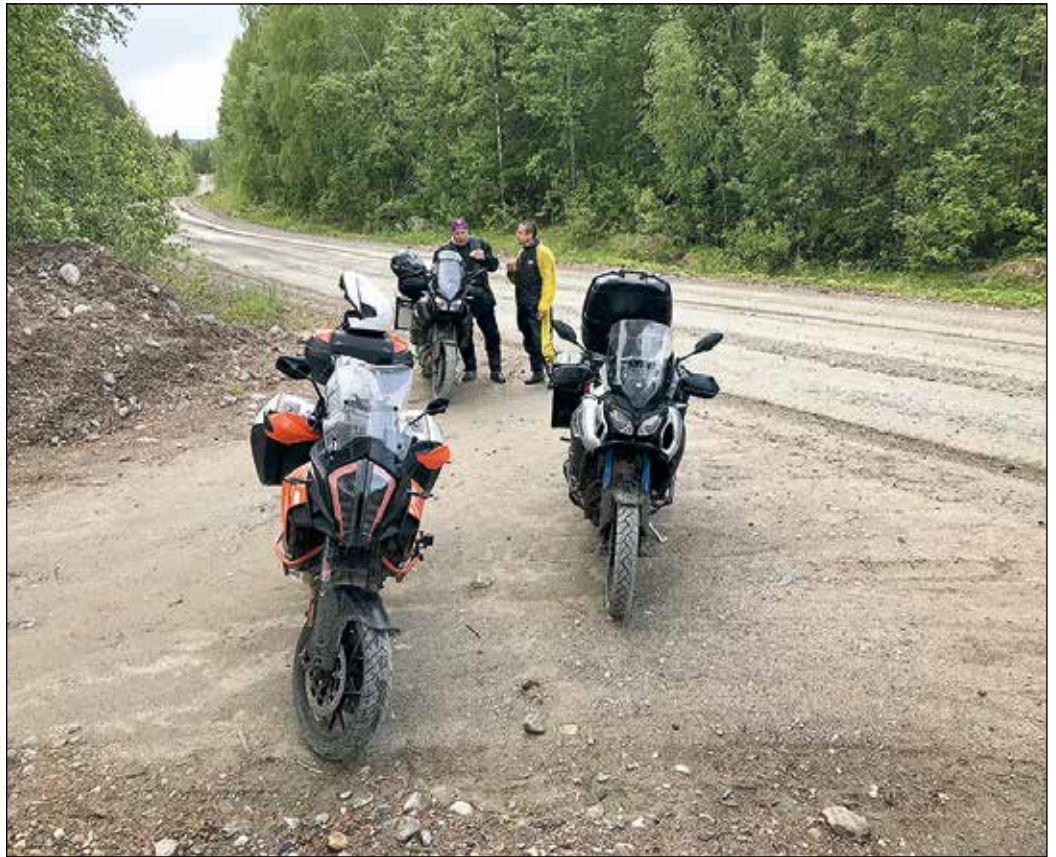
Suuntana meillä oli toisena kesäkuuna peräkkäin Vienan-Karjala.

Paperisodasta selvittiin kyllä kohtuudella, vaikka kaikilla ei pikkulappuja ollutkaan, vaan ne täyteltiin vasta rajalla. Sen sijaan ongelman meinasi muodostaa laukuista löytyneet 59 venäjänkielistä Motoristira-