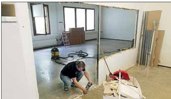
Huoneiden väliin puhkaistiin reilu kulku- ja ikkuna-aukko.