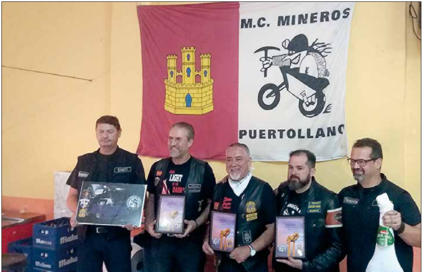
Juhliven kerhojen vetäjät ja saadut huomionsoitukset.