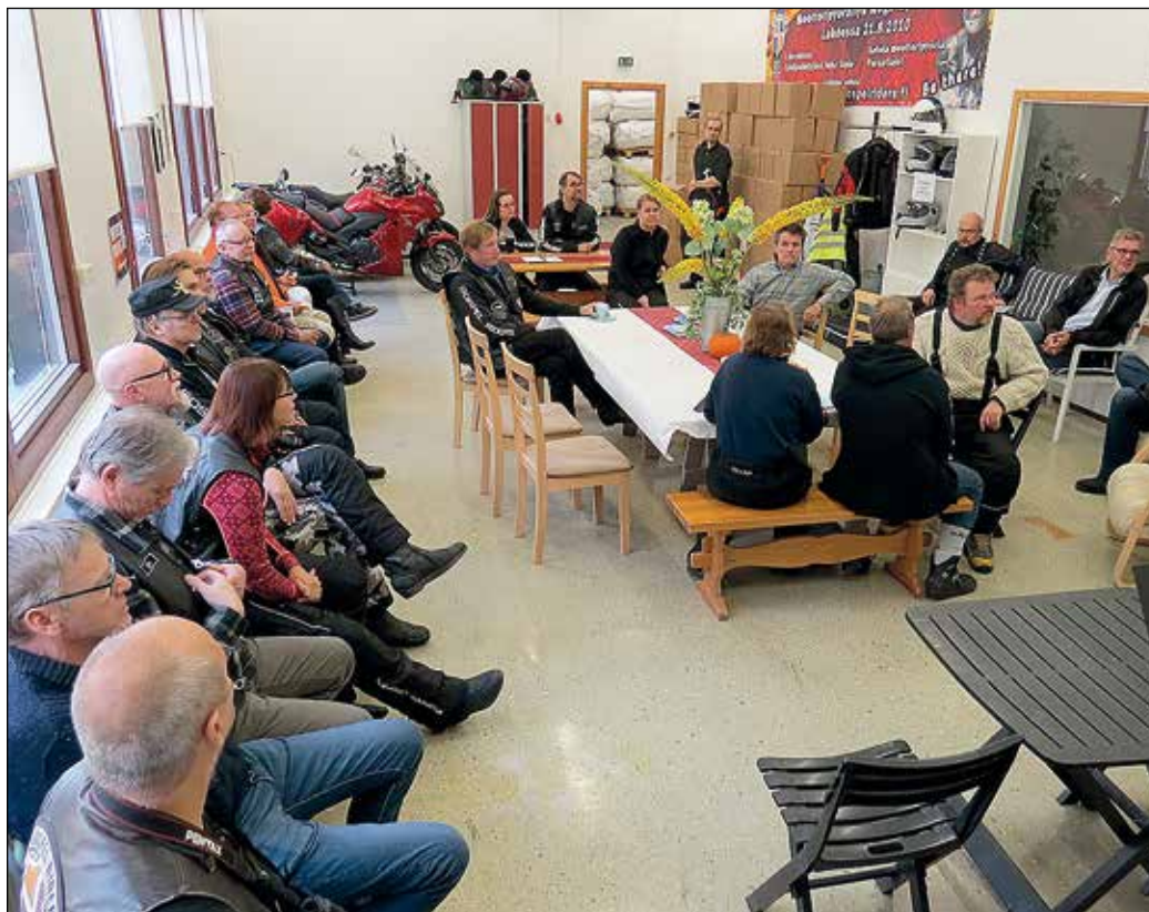
Tupareihin oli saapunut juhlaväkeä ilahduttava joukko eri puolilta eteläistä Suomea.

GR Lahden porukoissa kävi melkoinen viuhke toukokuusta