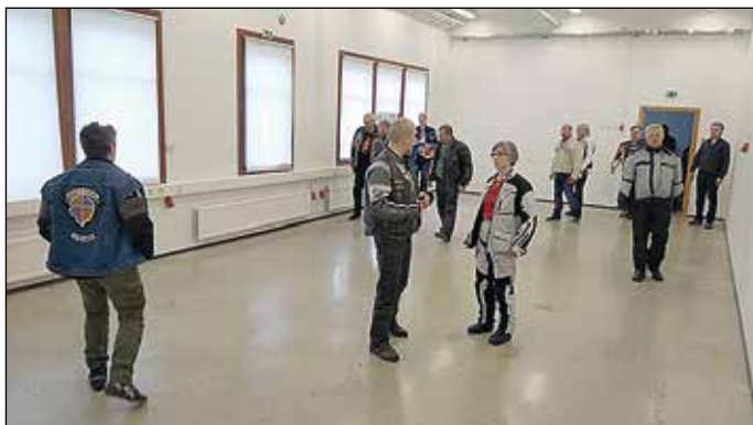
Myös isompi tyhjä tila ammotti tyhjiyttään vielä alkukesällä.