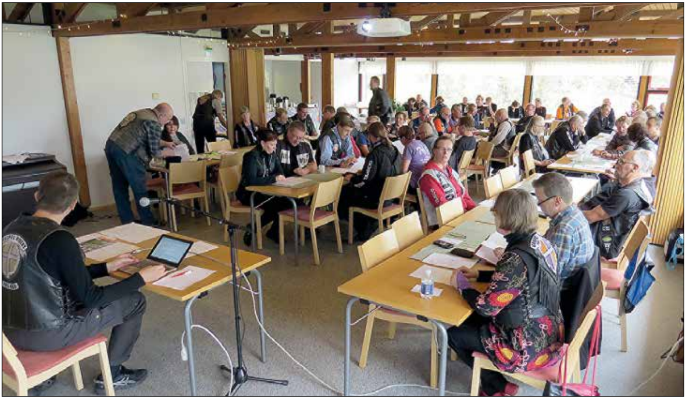
Tupa tuli täyteen, kun syyskokoukseen osallistui 63 kerholaista.