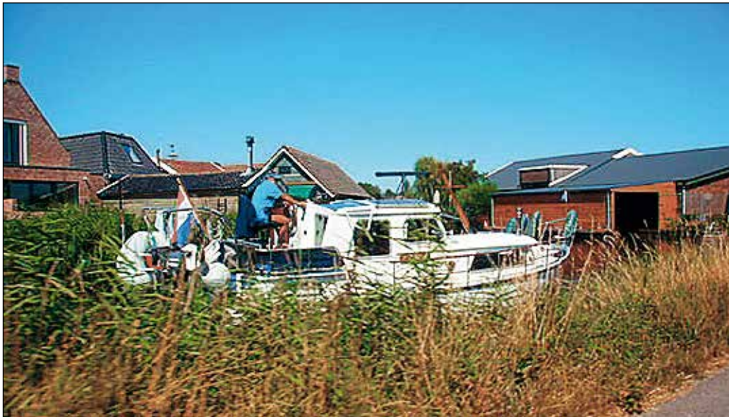
Pieniä taloja ja hyvin hoidettuine puutarhoineen ja kanavien tai vesihautojen ympäröiminä, isompia kanavia, joissa purjehti ja seilasi kaikenkokoisia paatteja

siellä oleva museo. Norrköping ja Linköpingit jäivät taakse ja isolle Vättern -järvelle saavuttuamme ajoimme rantaviivaa pitkin väliin maisemaa ihailen ja aprikoiden kerääntyvistä pilvistä, että mahtaa kolla sade ennen Huskvarnaa. Alapuolellamme oli punavalkoinen polkagris -karkkikylä Gränna, tutustumisen arvoinen paikka. Hiinä ja hiinä, museon parkkipaikalle saavuttuamme alkoi pisaroida ja sitten ukkonen jyrähti kunnolla ja kaiku kalliosta oli mahtava.