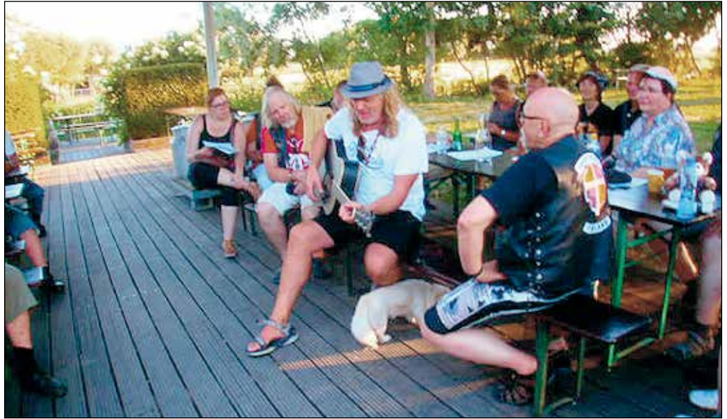
Ennen iltaservicea me suomalaiset pidimme oman meetingimme kanavan rannalla. Joukkoomme tuli muukalainen kitaramies, joka lainasi soitintaan Esalle ja hän säesti laulumme. Vierailija soitti itsekin.

Tankkaus- ja kahvitaukoja pidettiin. Jossain Bremenin paikkeilla oli taas suuri tietyömaa, ja valitsimme yhden kaistan väärin, josta seurasi, että ajoimme noin 8 km ennen kuin pääsimme kääntymään ympäri ja juuri sille ruuhkaiselle kaistalle. Pääsimme hyvin