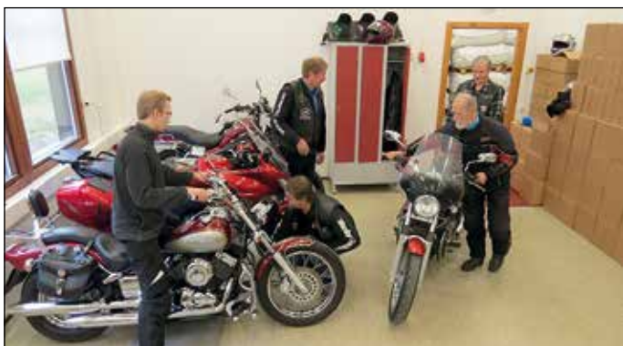
Tuparipäivänä tuli myös muutama pyörä Lahteen talvehtimaan.

Uuden tallin oleskelutilassa oli valmiina mukava keittiönurkkaus jääkaappeineen, tiskipöytineen ja astianpesukoneineen. Oman porukan voimin oleskelupuolelle asennettiin tuota pikaa videoprojektori, joka on ollut syksyn aikana käytössä melkein joka viikko, ja muuta tarpeellista. Pakastinkin sinne ilmestyi syksyn mittaan ja hiljattain vielä hella.