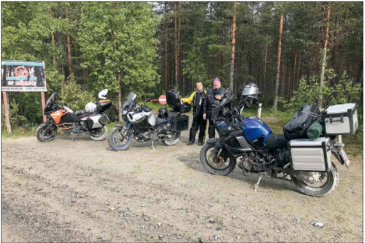
Joukkomme jakaantui Kostamukses- sa kahdeksi.