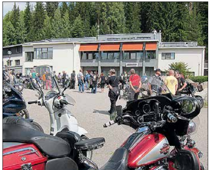
Punainen Harrikka ja valkoinen Vespa vierekkäin, taisivat olla MOJ:n suurin ja pienin rinnakkain.