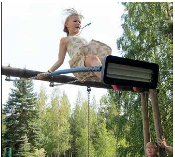
Aala näytti keinumisen mallia, mummi seurasi.