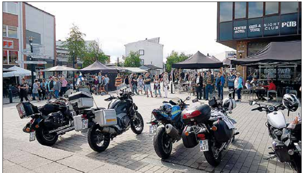
Imatran kävelykadulla oli runsaasti väkeä, mutta uusien ohjeitten mukaan vain viisi pyörää sai tuoda esiintymislavan eteen.

Kokoonnuimme ABC:lle, jossa meitä oli kaiken kaikkiaan kolmisenkymmentä motoristia, pääasiassa CMA:sta, GR:läisiä oli 11. Ihania veljiä ja siskoja, jotka tulivat tapahtumaan mukaan lehdenjakkoon keskustassa, varikolla ja ajoalueella.