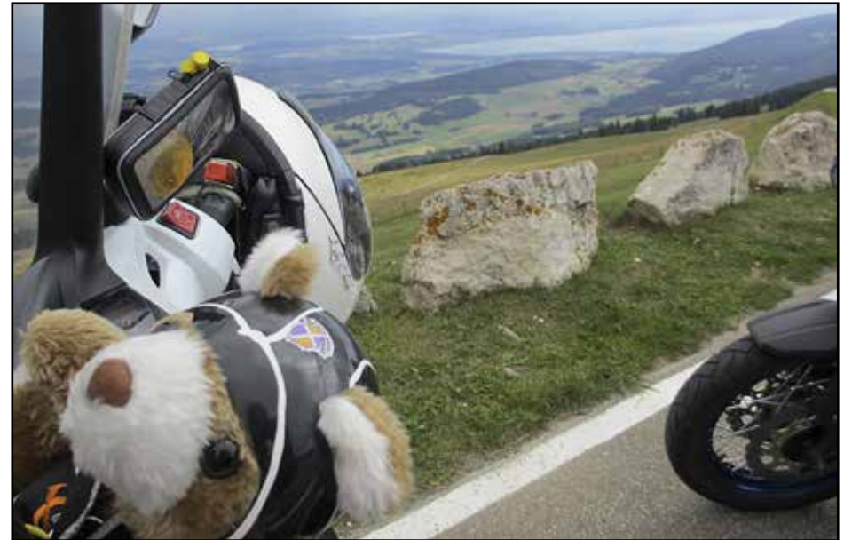
Saksalaissyntyinen, Espanjan EMC:stä adoptoitu Garhu Rohkea Sveitsin Jura-vuoristossa, (kierto)matkalla Latvian EMC-rallyyn.