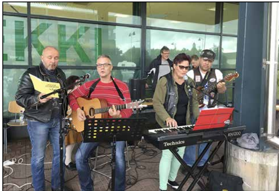
Musiikki on vahvassa roolissa Gospel Riders 7xSF kiertueella. Tässä ollaan Huittisissa K-kauppa Lautturin pihalla.

min näkökulmasta operaatio perustuu Jeesuksen lähetyksenkäskyyn: "Menkää ja tehkää kaikki kansat minun opetuslapsikseni". Tämän käskyn toteuttaminen on ollut meille osallistuneille suuri ilo. Ihmisiä on tullut uskoon ja hengellistä hedelmää on nähty paljon