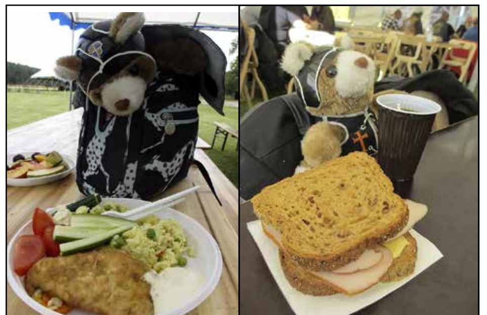
"Ja ruokaa!" Hyvää ruokaa tekivät meille. Sitä oli tarjolla ennakkoon tilanneille monta kertaa päivässä. Ja paikalla oli myös grilli-/kahvilavaunu.