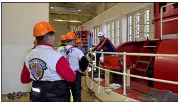
Pyhäjoen voimalaitoksen turbiinihalli

mallisen kesäkävion terassilta aukeaa vaikuttava näky: tuhatkunta turvepäistä hahmoa kainuulaisella niityllä. Selvisi, että kyseessä ovat samat vaetetut heinäseipäät, jotka pyörähtivät 1994 Helsingin tuomiokirkon portailla Kainuun maakunnan esittäytyessä Senaatintorilla. Sen saatoimmekin hämähästi muistaa. Ensimmäisen kerran Hiljaisen kansan toteutti tanssija Reijo Kela vuonna 1988.