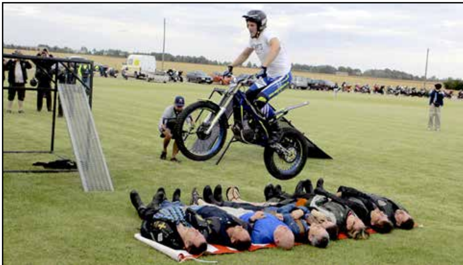
Ammattilainen hoiti hommansa; lyhyt kiihdytys ja hallitusti kahdeksan ihmisen yli.

EMC tapahtumassa oli taas kiva tavata aikaisemmista tapaamisista tutuksi tulleita biker-ystäviä sekä kotimaasta että ulkomailta. Suomalaiset olivat perinteiseen tapaan hyvin edustettuina. Jäsenmäärältään suurimman kerhon, Gospel Ridersin, jäseniä oli luonnollisesti eniten. Tarkkaa lukumäärää en saanut laskettua, mutta 70 lienee melko hyvä arvio.