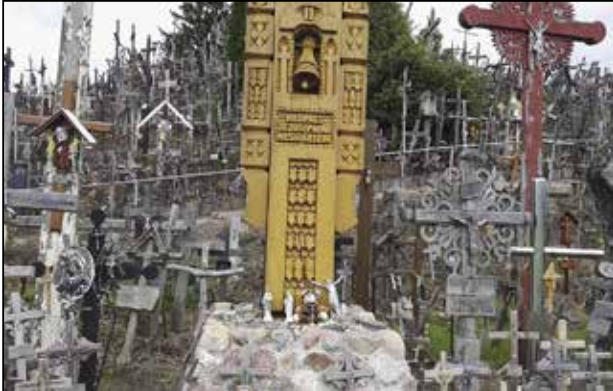
"Kylläpä niitä on paljon! Satoja tuhansia kuu- lemma."