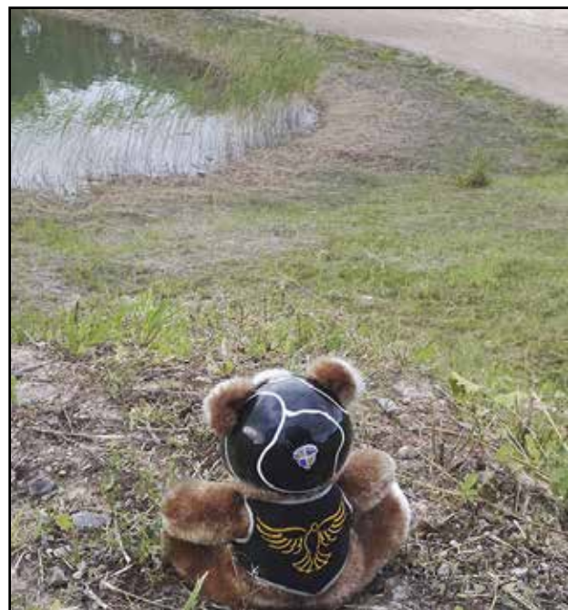
Oma pieni järvi, jonka äärellä hiekkaranta.

Gospel Riders tapahtumat www.gospelriders.fi