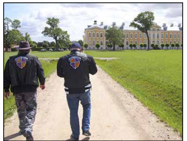
Ajatus kesäasunnosta tuo yleensä mieleen vaatimatoman rakennuksen kuin 130-huoneisen Rundalenin palatsin.

Itselleni ristikukkulan tarina kertoo tyhjän ristien sanomasta. Kristuksen ylösnousemuksen voimaa eivät maalliset vallat ja voimat kykene tukahduttamaan — edes mahtavilla puskutraktoreilla. Mieleeni tulevat laulun sanat: "Tuhkasta nousee aamu, aamu uus, ikuinen. Tuhkasta nousee aamu, jos vain uskot Kristukseen."