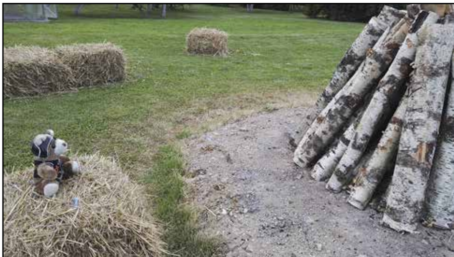
Iltanuotiopaikka. Istuinpaalini oli tosin pelottavan lähellä nuotiota.