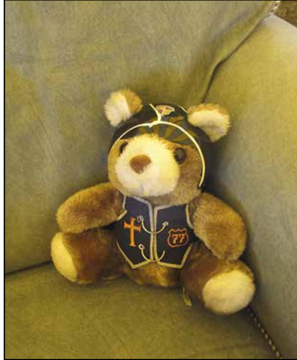
Päivällä sainkin sitten istua ohjelmateltan pehmeimmällä paikalla. Se oli mukavaa, koska hyviä puheita ja lauluja riitti koko päiväksi.