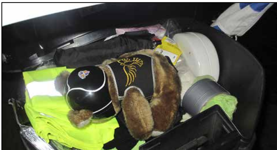
Perillä joutui tämä urhea repsikka nukkumaan yönsä Hondan takaboxissa. Kuskini nukkui Vespa-miehensä kanssa mainiossa majoitusmökissä noin kahdeksan kilometrin päässä.