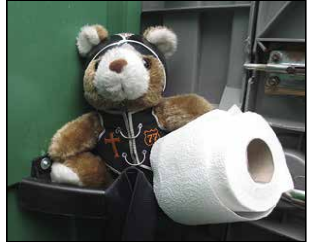
"Huh helpotusta!" Perillä Latvian EMC:ssä pitkän, mutta hyvin sujuneen matkan jälkeen. Onneksi olivat hoitaneet nämä Baja-majat paikoilleen.