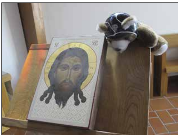
Rallin toinen ajelu suuntautui Liettuaan. Kohde oli Ristikukkula ja läheinen luostari.