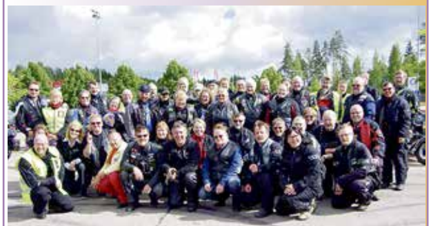
MOJ on Gospel Riders -moottoripyöräkerhon virallinen päihteen vuotuinen kokoontumisajo johon kaikki motoristit ovat tervetulleita.

Vuoden 2018 MOJ-meeting järjestetään Siikaniemen kurssikeskuksessa Hollolassa 13.-15.7.2018.