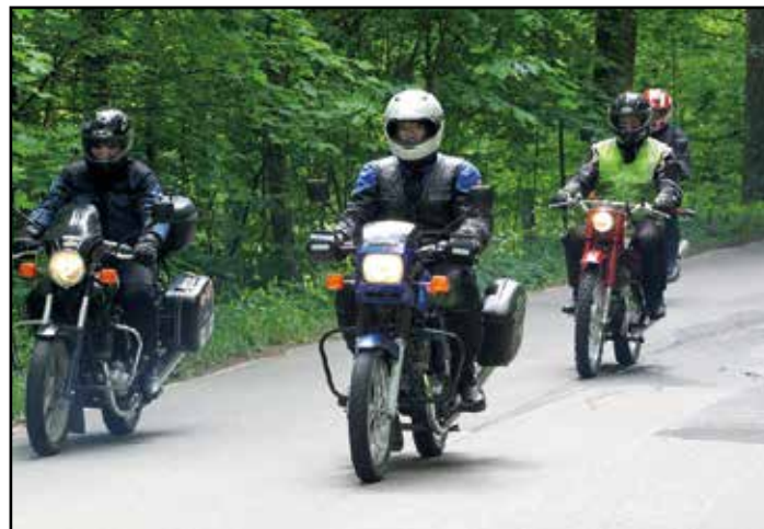
Paraatijajo Espoon automuseolle.