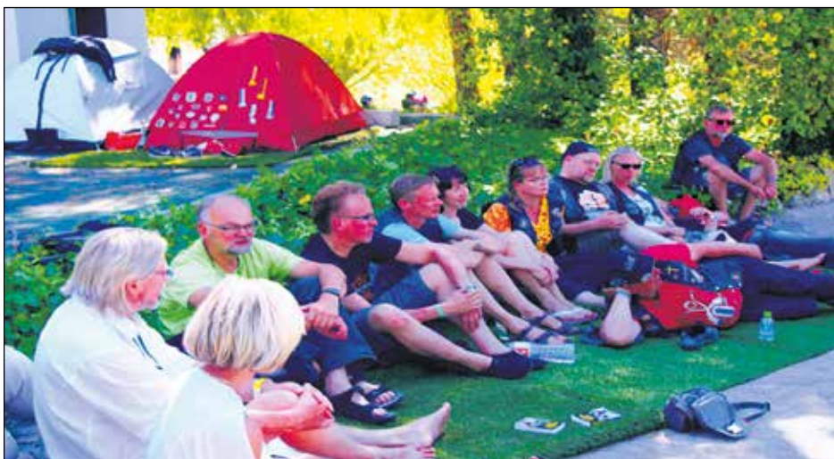
Suomalaiset yhteistilaisuudessa auringon paahteessa.

skootteria. Ehdin jo ajatella, että silloinhan kotona olisi kaksi Vespa. Tämä skootteri vaikutti kuitenkin vähän pieneltä. Kun katselin ympärilläni, silmiini osui helmenvalkoinen Honda-merkkinen skootteri. Siinä se näkyi mukainen skootteri oli, ja saimmehan sen myötä kotiin kaksi Hondaa.