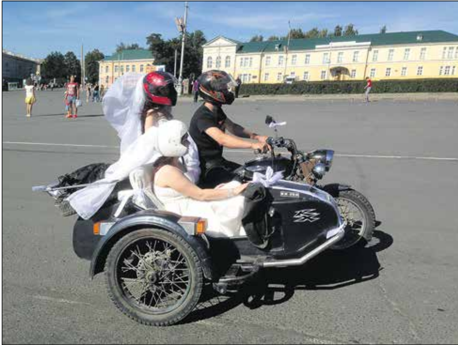
Menopelit voivat Venäjällä olla monenmoisia. Katsastuskäytännöt ovat ilmeisesti meikäläisiä vapaampia, mutta aina silloin tällöin tulen ihmetelleeksi ajosujuja. Tämäkään pari ei suinkaan ole menossa vihille morsiusneito mukanaan.

Sortavalasta Lahdenpohjan suuntaan vievän tien asfalttia ollaan uusimassa. Työmaata kestää noin reitin puoliväliin. Tietyö oli hyvässä vauhdissa kesäkuussa 2016. Uskon, että viimeistään kesällä 2017 tälläkin välillä on uusi, loistava asfalttipinta, kuten loppupätkällä Lahdenpohjaan. Tämänkin tie kulkee parin kylän läpi, joissa nopeutta pitää laskea, mutta muuten se on lähellä as-