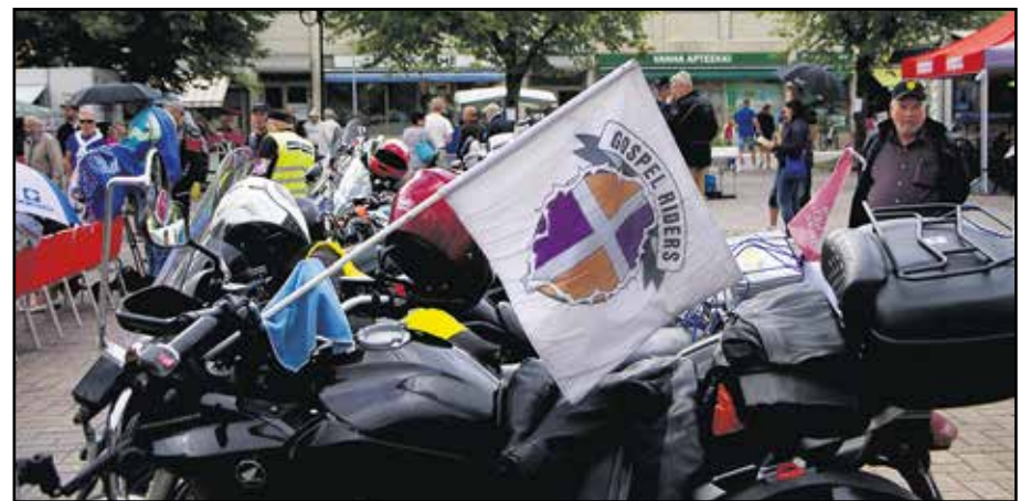
Sata lasissa –teemalla toteutettava kampanja saavuttaa tänäkin vuonna sata paikkakuntaa.

Siitä on kyse. Siksi toteutamme Sata lasissa –ajon kesällä 2017. Tervetuloa mukaan.