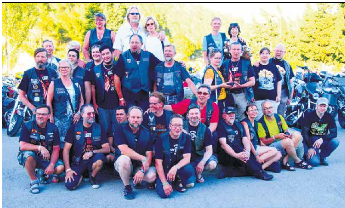
Gospel Riders Finland ja Gospel Riders Espanja yhteiskuvassa.

Ulkomailla järjestettyjen EMC-rallien perinteen on kuulunut suomalaisten yhteistilaisuus. Niinpä kokoontuimme lauantaina suurella joukolla laulamaan suomalaisia lauluja. Ruokailussa olimme jo viritelleet äänijänteitä laulamalla omissa pöydissämme "Nyt silmäin alla Jeesuksen." Vaikka olin kuutosen lauluäänellä mukana kuorossa, järjestäjät pysivät vielä uuden esityksen yhteisenä ruokakouksena.