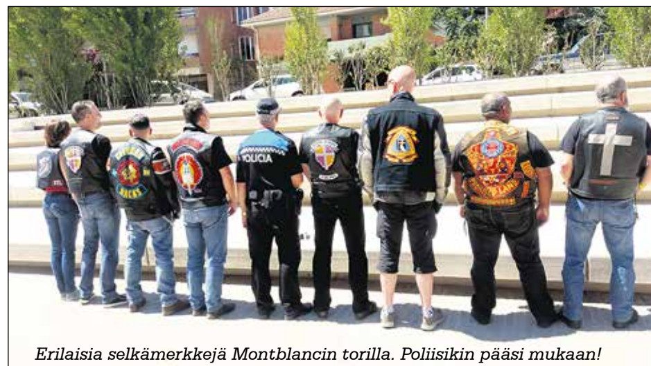
Erilaisia selkämerkkejä Montblancin torilla. Poliisikin pääsi mukaan!