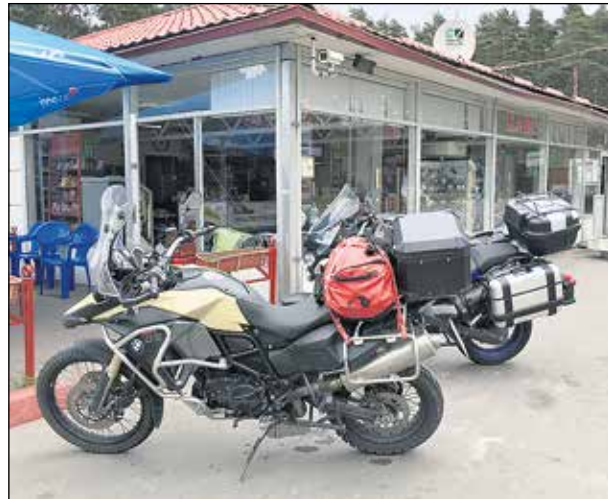
Bensa-asemalla Käkisalmen paikkeilla.

Rajavyöhykkeellä on heti ensimmäisen passintarkastuksen jälkeen LUK-ketjun asema. Pyörät tankattiin piripintaan, vaikka 95E olikin täällä selvästi kalliimpaa kuin vähän aikaisemmin. Hinta oli kesäkuun 2016 ruplan kurssilla 0,52 euroa litralta eli vajaat 40 prosenttia rajan toisen puolen hinnasta.