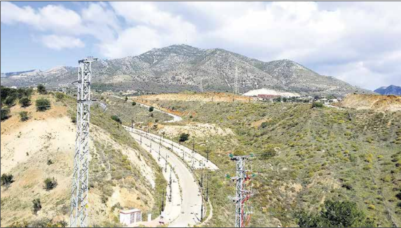
Moottoriteitä välttellessä löytyi hienoja vuoristomaisemia