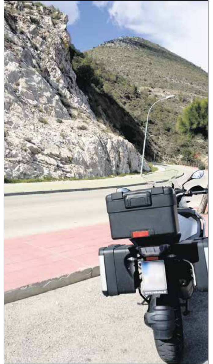
El Chorro löytyy näiden vuorten toiselta puolelta.