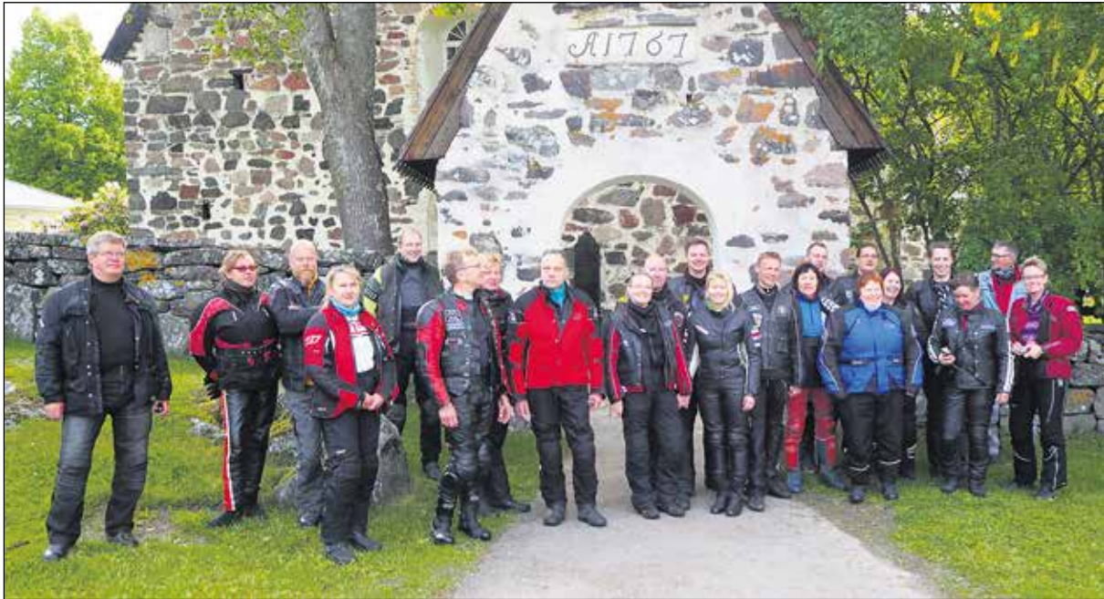
Ryhmäpotretti Nauvon vanhan kirkon edessä.