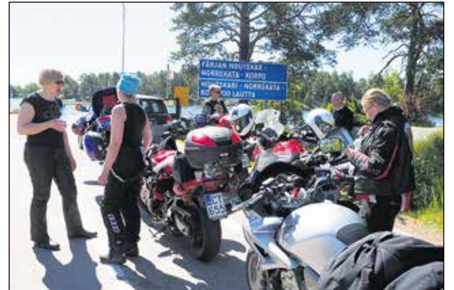
Sunnuntaiamuna sää muuttui helpeisen lämpimäksi ja vesi maistui hyvältä.