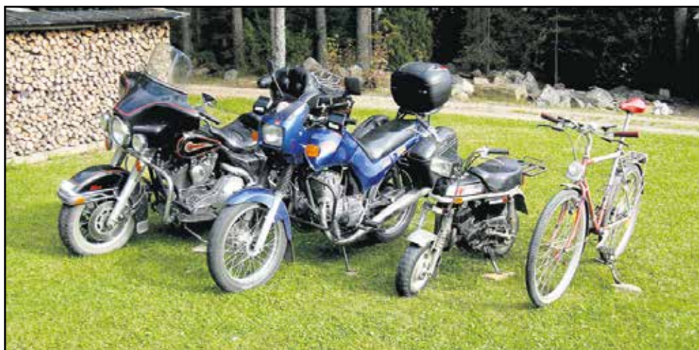
Elämäni kaksipyöräiset 1987-2016