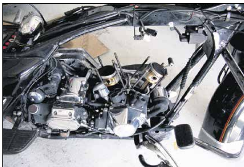
Ora et labora – rukoile ja tee työtä.

Olin ollut motoristi vasta kolme kuukautta ja juuri liittynyt Gospel Ridersiin. Halusin vain Jawan ja uneksinkin retkestä Pohjois-Karjalaan. Vuotta aikaisemmin en ollut edes uskonut olevani tulla koskaan motoristiksi. Hyvä poika, ositt sitten Jawan. Treenaa nyt sillä, mutta tässä on sitten sinulle kunnon prätäkä. Mene sillä kauas! Vilkkaassa mielikuvituksessani laitoin Jumalan suuhun tuollaisen kommentin asiasta. Mitä se