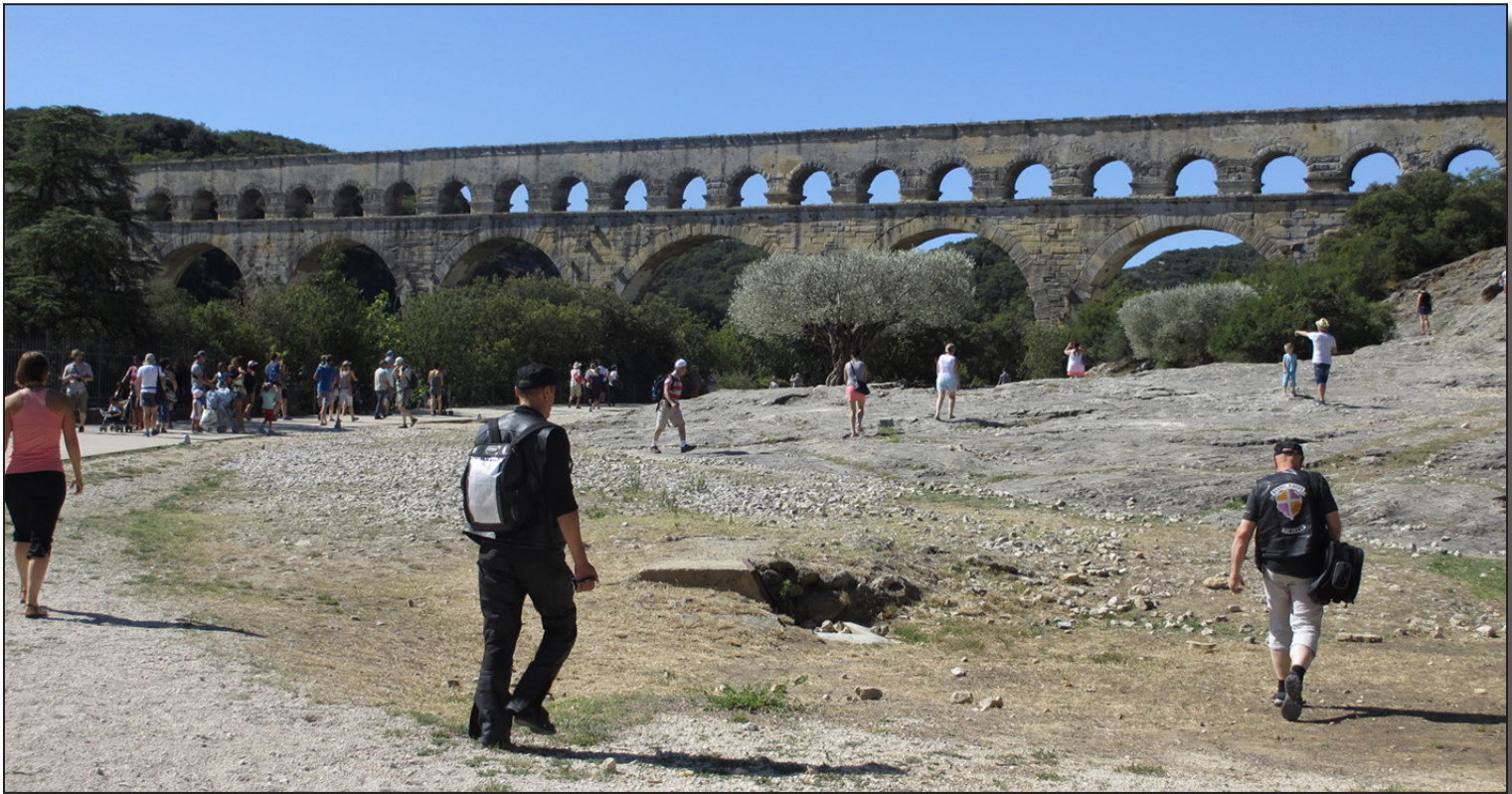
Akvedukti Nimesissä on muinaisen insinööritaidon mestarinäyte.

Superhieno kokemus Sveitsissä oli käynti Reinin putouksilla, jotka ovat Euroopan suurimmat. Kosken viereen tehdyillä tasanteilla tunsin ihmisen pienuuden luonnonvoimien rinnalla. Samoin Jumalan suuruuden. Hän on luonut meidätkin ja rakastaa kaikkia yhtä paljon, olimmepa millaisia tahansa. Armosta ja rakkaudesta, Jeesuksen tähden!