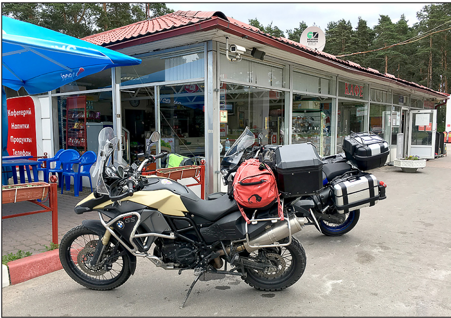
Bensa-asemalla Käkisalmen paikkeilla.