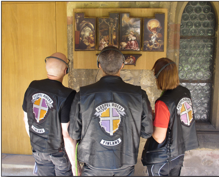
Isenheimin moniosainen alttaritaulu Colmarissa.